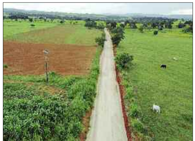
Recuperação de estradas vicinais é fundamental para a produção