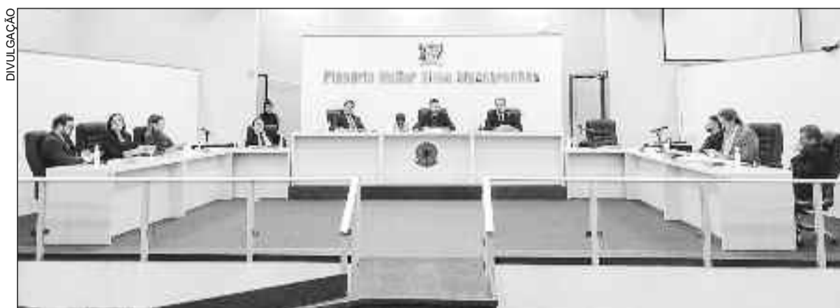
Veredores em mais uma sessão ordinária: este ano já foram aprovados 166 requerimentos no plenário