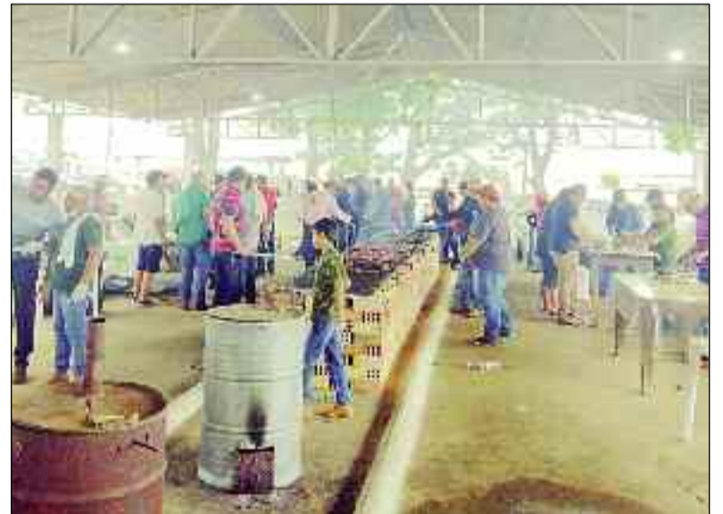
Churrasco para milhares de moradores que foram comemorar a vitória