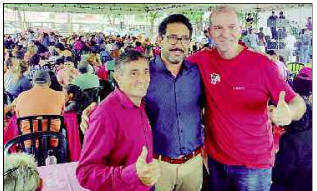
Prefeito recebe carinho da comunidade, que lhe garantiu mais quatro anos de mandato