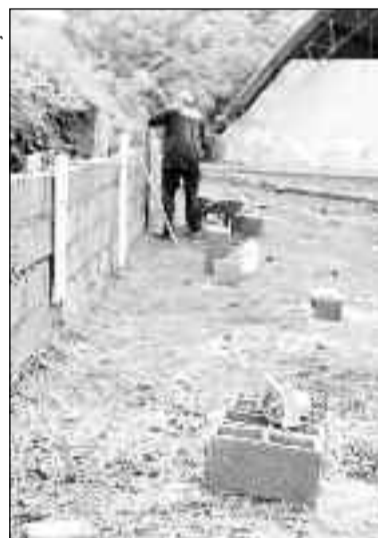
Trabalhadores trabalham dia e noite para concluir as obras