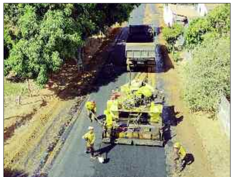
Pavimentação de ruas no povoado assegura mais qualidade de vida