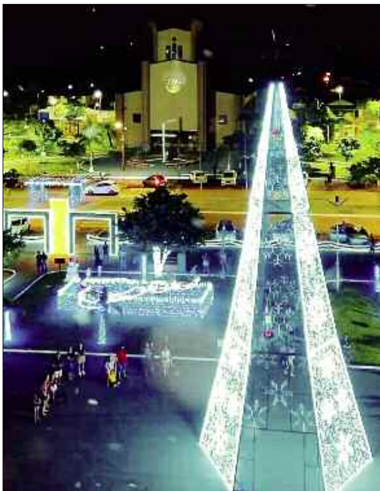
Praça da prefeitura toda decorada com uma belíssima iluminação

"Rianópolis está iluminada e enfeitada. Parabéns a todos que contribuíram para que esta belíssima ação ocorresse, em especial a Assistência Social e Secretaria de Educação. A cidade convida a todos para prestigiar as luzes de Natal", disse o prefeito Gilber.