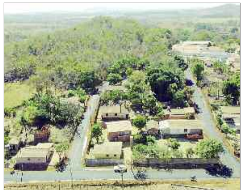
Vista aérea mostra ruas de distrito pavimentadas: mais avanços sociais

compromisso da atual gestão, que cumpre mais uma etapa, contribuindo diretamente para a melhoria da vida de milhares de pessoas.