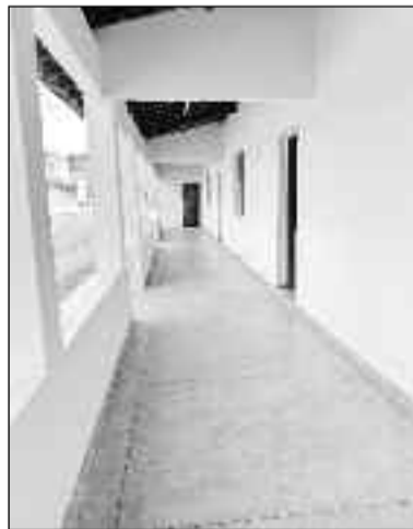
Prédio passa por ampla reforma

mento e promete trazer novos ares ao local. Após anos aguardando por melhorias, o ginásio receberá uma estrutura modernizada, pronta para sediar eventos esportivos, culturais e sociais. A revitalização do ginásio representa mais uma conquista para a cidade, que valoriza o esporte e o