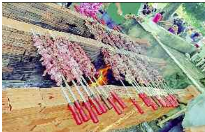
Muita comida para atender os moradores de Rianópolis: festa popular