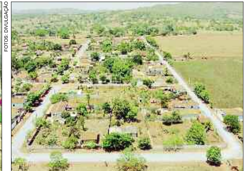
Pavimentação em todo o distrito para melhorar a qualidade de vida