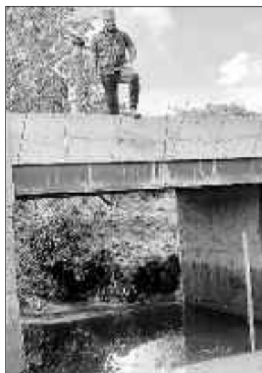
Vistoriando obras de mais uma ponte para atender produtor rural

A reforma do Ginásio de Esportes também está em anda-