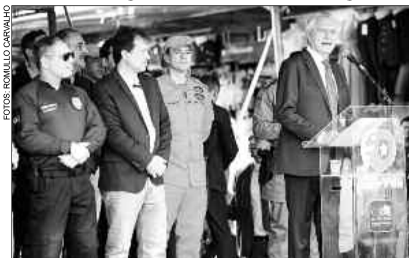
Governador anuncia reforço na segurança para as festas de Natal

Com coordenação da Secretaria de Estado de Segurança Públi-