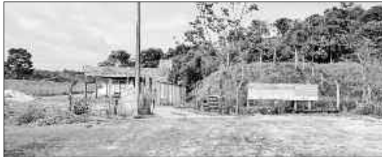
Mais uma obra sendo executada na cidade de Pilar de Goiás: avanços