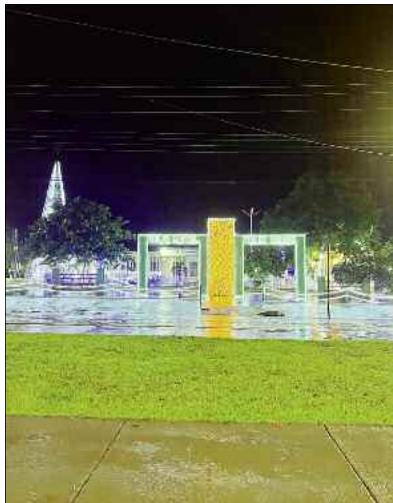
Luzes de Natal já decoram diversos pontos da cidade e encantam