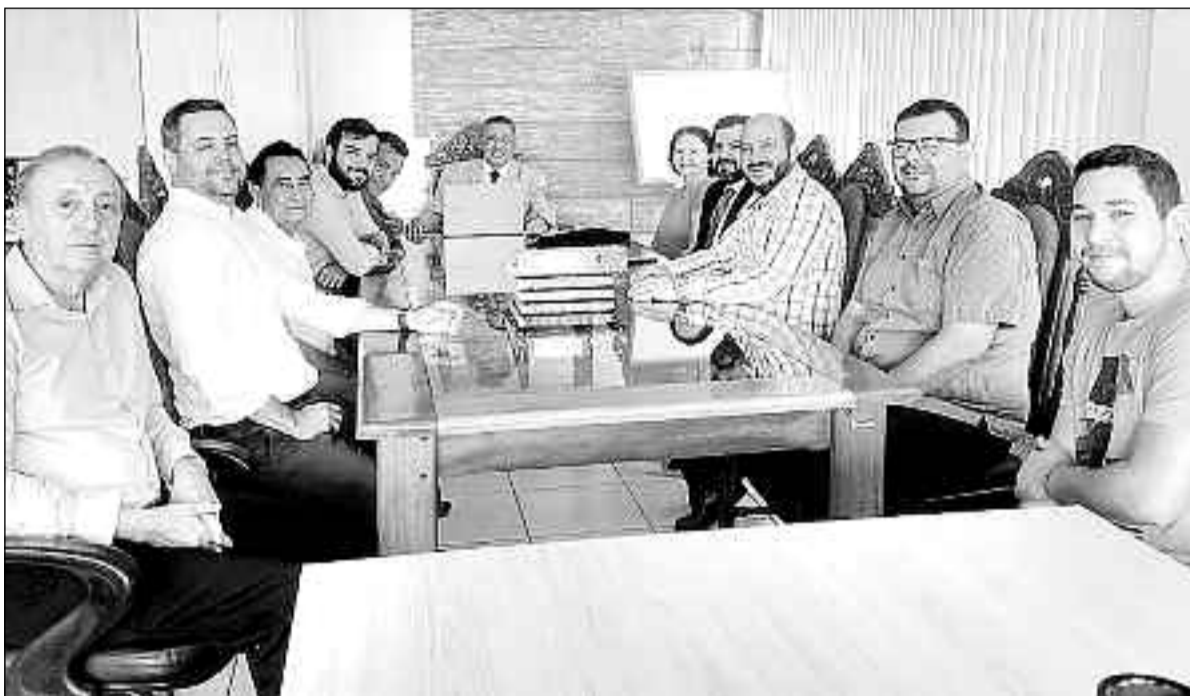
Reunião de transição em Ipiranga de Goiás: momento de diálogo para entender situação fiscal da prefeitura