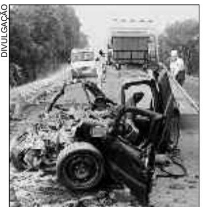
Veículo fica completamente destruído após grave acidente

A Ecovias do Araguaia, concessionária que administra o trecho da rodovia, foi uma das pri-