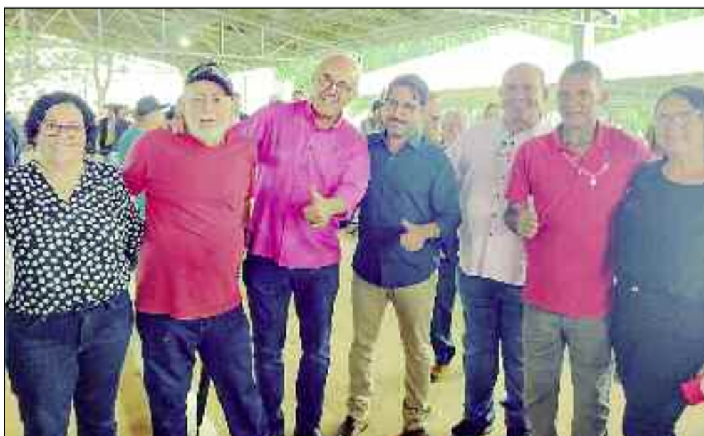
Com lideranças políticas para celebrar a vitória e preparar cidade para mais 4 anos