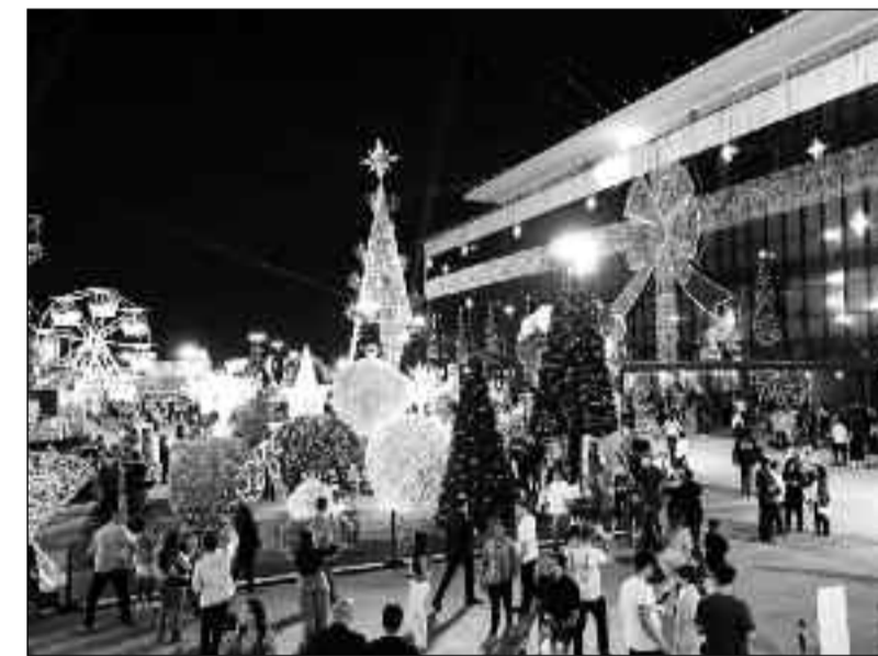
Natal do Bem aberto para a população: festa que mobiliza milhares

O governador ressaltou que, apesar da festa estar montada em