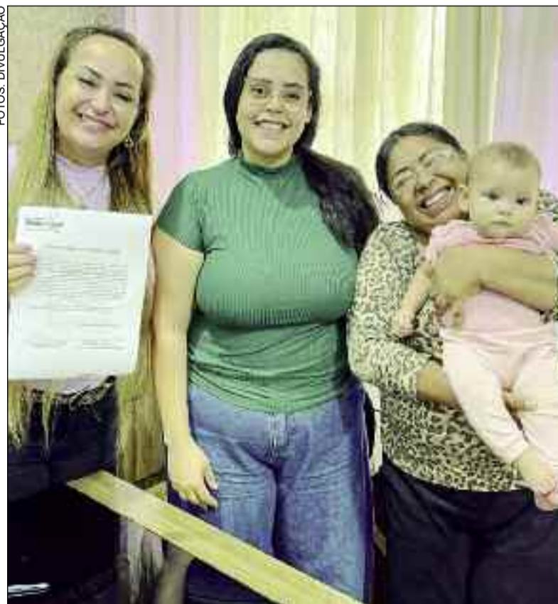
Prefeitura conta com novos servidores para melhorar o atendimento

vindas a todos e que venham para somar. Buscamos à frente da Prefeitura fazer um trabalho sério, com foco no planejamento, em que cada pessoa tem um papel importante, sempre de olho na coletividade".