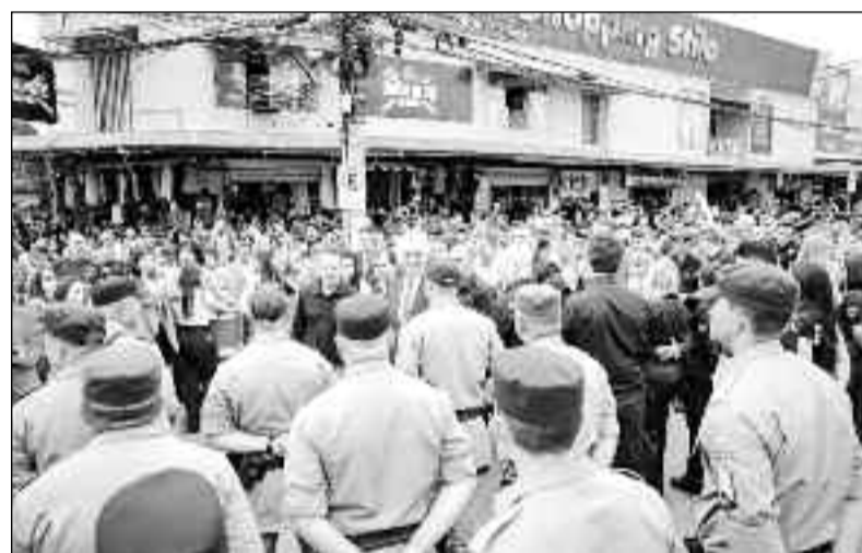
Aumento do policiamento na capital para garantir mais segurança

"Nos próximos 45 dias vamos atuar de forma integrada com as forças estaduais, federais e municipais em trabalho simultâneo nas áreas comerciais das 246 cidades de Goiás. O objetivo é dar maior segurança a lojistas e con-