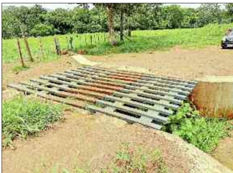
Instalação de mata-burros para atender o produtor rural de Uruana