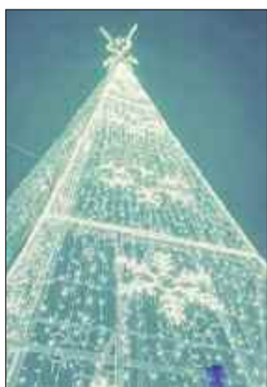
Árvore de natal decora a cidade