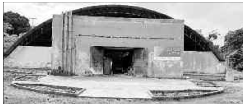
Ginásio passando por reformas para ampliar atendimento no esporte

Para acompanhar de perto o andamento dessas e de outras obras, os moradores podem seguir as redes sociais da Prefeitura de Pilar de Goiás, onde são postadas atualizações e novidades sobre cada uma das etapas das reformas e construções.