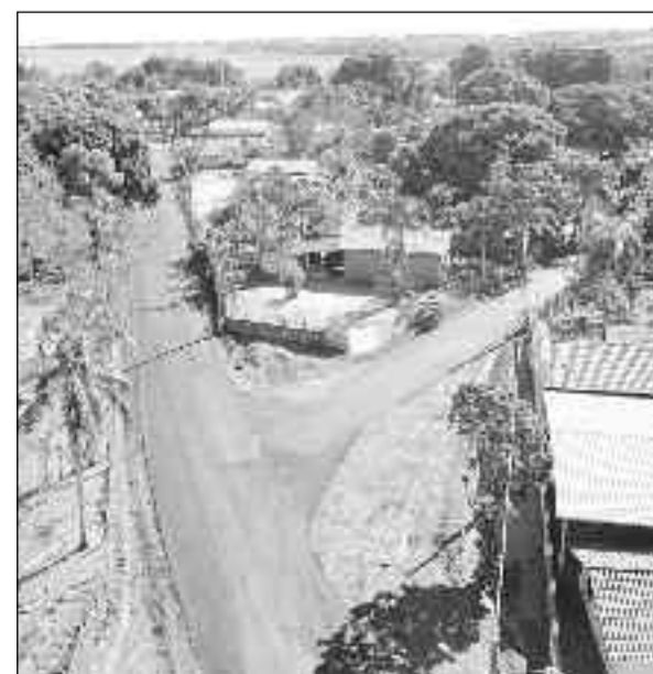
Ruas do Povoado recebem massa asfáltica nas ruas