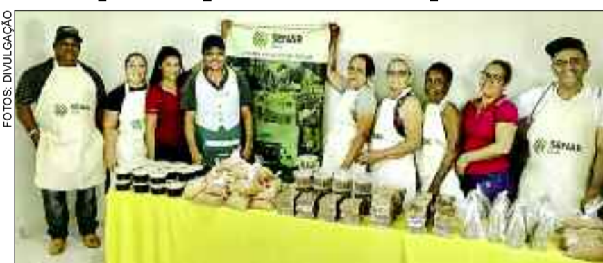
Curso ensina produzir derivados da cana de açúcar para os trabalhadores

De acordo com um participante, a capacitação dos produtores de São Luiz do Norte vai possibi-