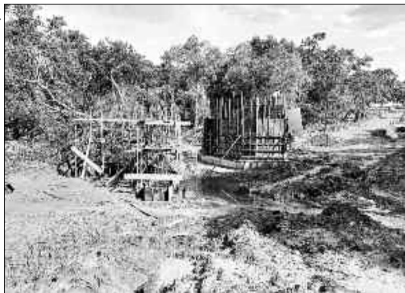
Obra representa conquista para região e melhoria na infraestrutura

feito e sua equipe vem trabalhando incansavelmente na recuperação de pontes e estradas vicinais, beneficiando todas as regiões do muni-