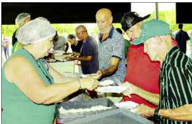
População ganhou de presente um jantar para comemorar a vitória

As comemorações da festa do 15 começaram no meio da tarde e se estendeu até a madrugada. Uma grande estrutura foi montada para receber a comunidade, que se