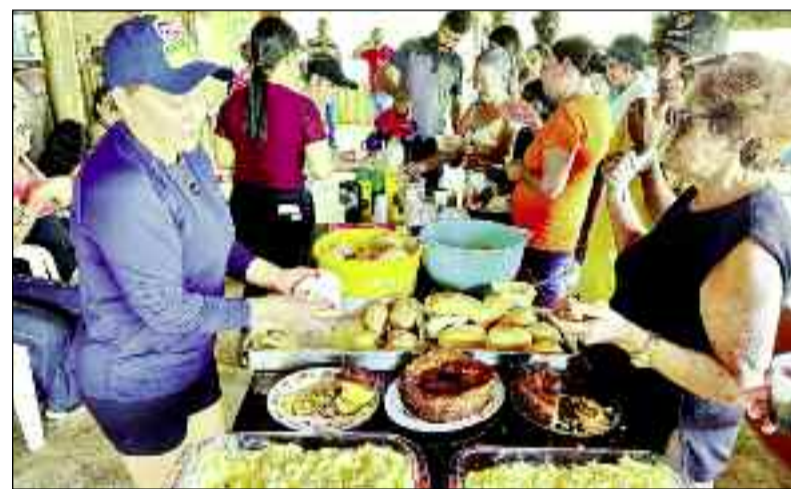
Café da manhã reforçado e caprichado para o pessoal da melhor idade

Gostaria de parabenizar a toda equipe da assistência e os demais envolvidos, pelo lindo evento. Nossa gestão segue sempre atenta à população em todas as suas faixas etárias, e assegurar que