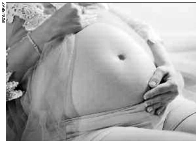
Iniciativa visa reduzir mortalidade infantil e materna em todo Estado

Entre as ações planejadas estão a ampliação da carteira de exames pré-natais, o reforço financeiro para os municípios e a atualização dos Planos de Ação Regionais. O proje-