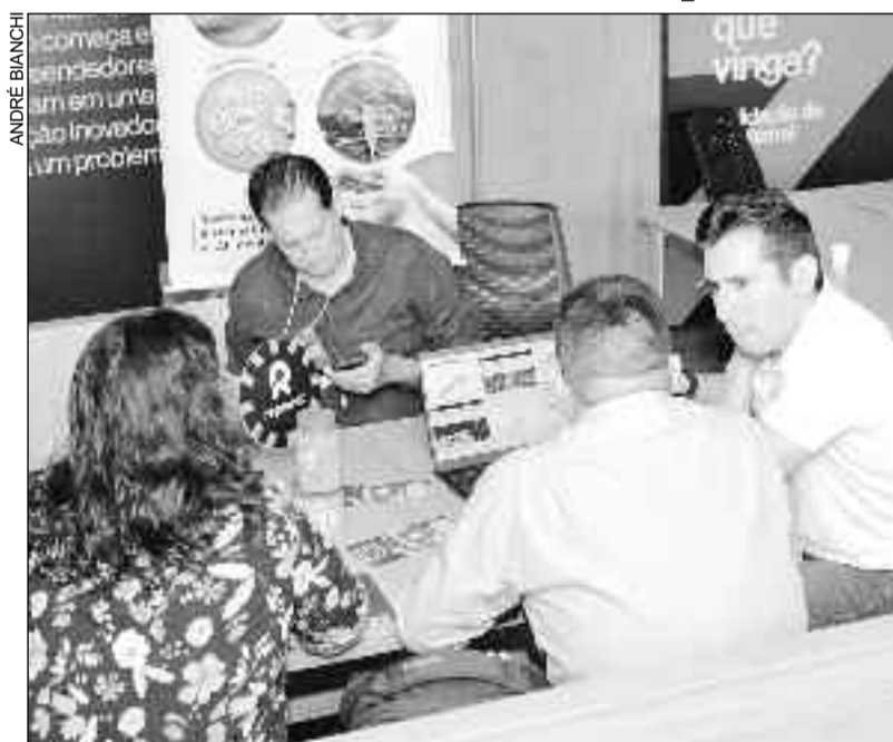
Para serem contratadas, as empresas vão precisar de muita inovação