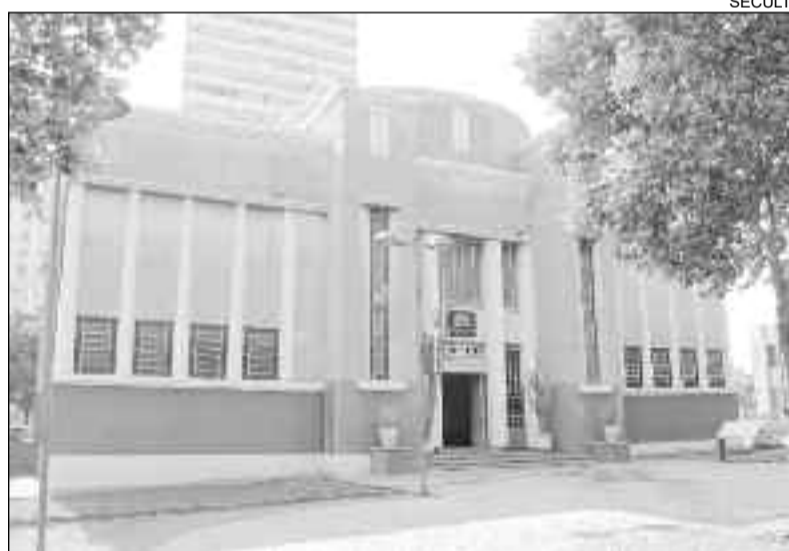
Espaço passará por reformas e melhorias pelo Governo do estado