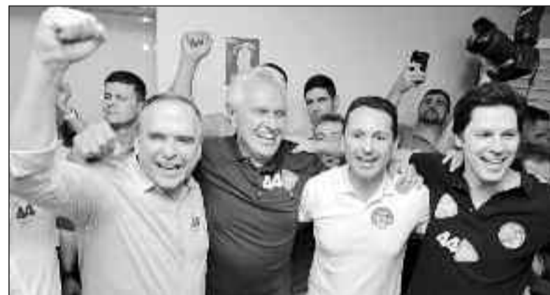
Governador supera o bolsonarismo em Goiânia e critica ex-presidente