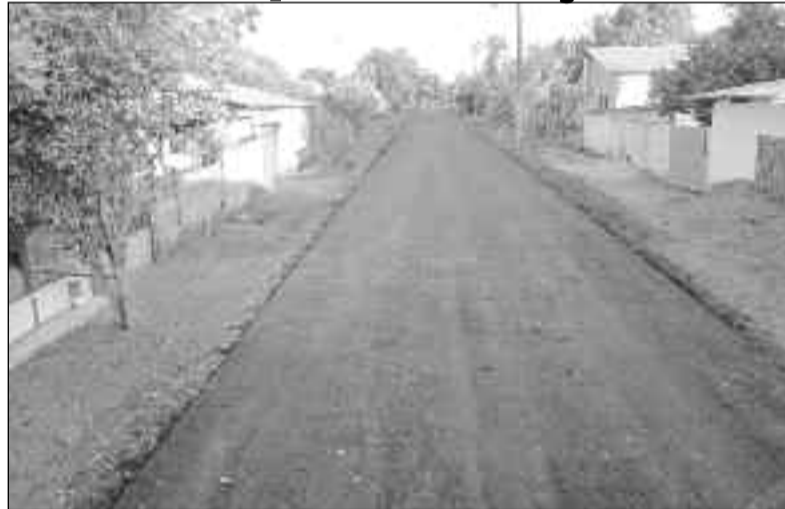
Povoado agora conta com asfalto: obras garantem qualidade de vida

A Prefeitura de Uruana reafirma seu compromisso de promover melhorias significativas para a população. Recentemente, foi concluída a segunda etapa do asfaltamento no Povoado Perilândia (Peri), uma obra de grande importância que garante infraestrutura e qualidade de vida para os moradores.