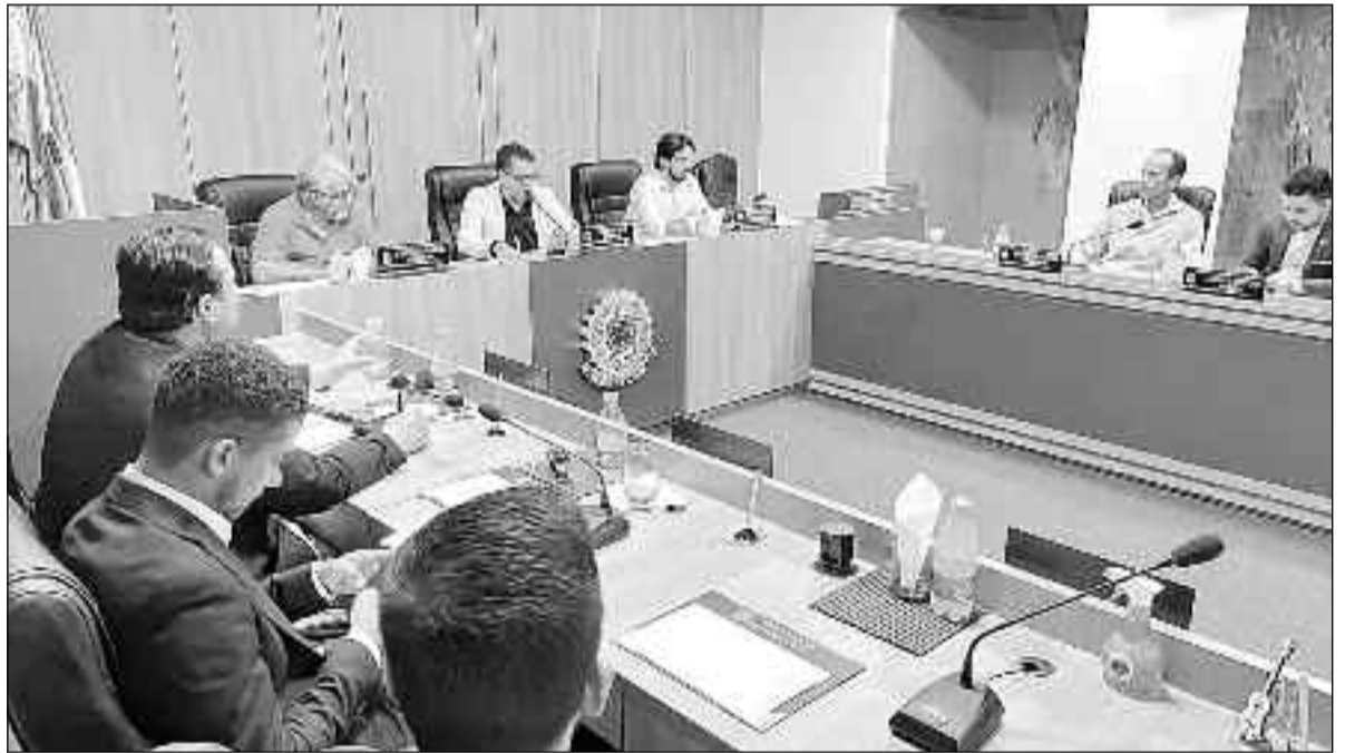
Vereadores em mais uma noite de trabalho na Câmara Municipal de Campinorte: muito trabalho e ação