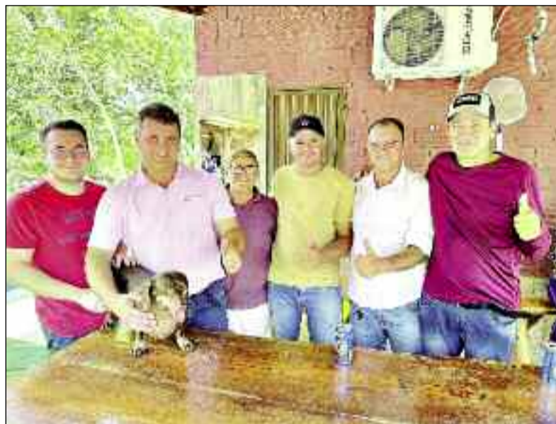
Prefeito com comunidade prestigia evento para os idosos da cidade