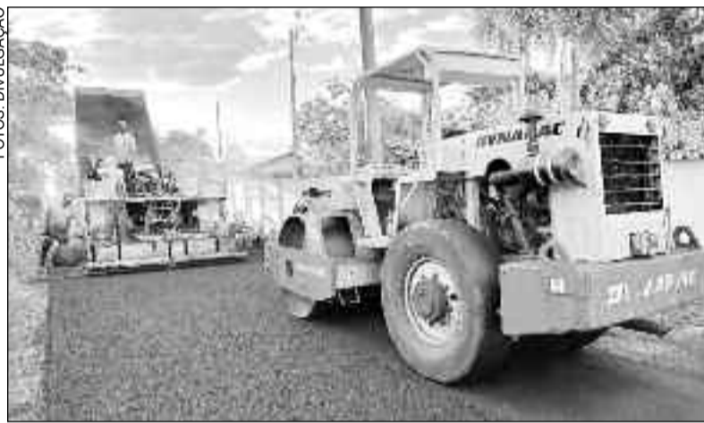
Mais investimento em infraestrutura agora no Povoado do Cruzeiro