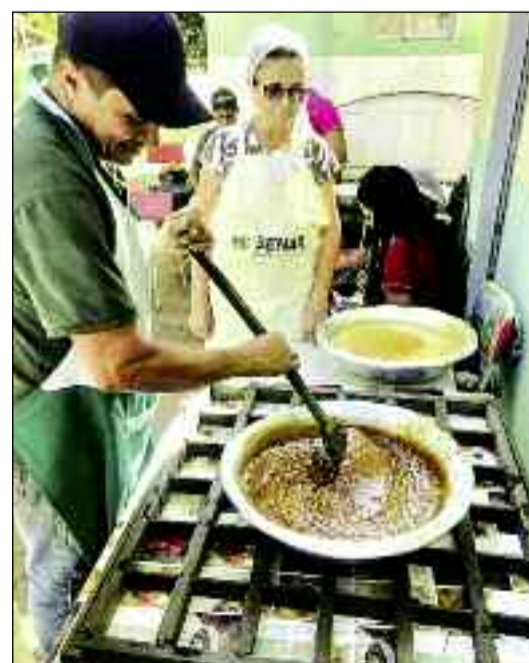
Produtores aprendem de forma artesanal melhor manejo com cana de açúcar

Segundo o instrutor, cada tipo de cana-de-açúcar resulta num produto diferenciado, dependendo da terra e da forma de cultivo. Por isso, segundo ele, a melhor cana é a orgânica. Essa planta apresenta como diferencial em relação à do plantio convencional sabor e cheiro mais acentuados e maior quantidade de nutrientes. É rica em minerais - como ferro, potássio e magnésio - e fornece energia para o corpo, servindo como suplemento alimentar.