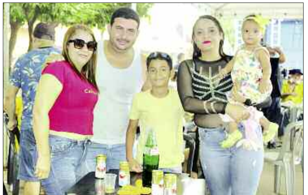
Moradores foram à festa da vitória e da democracia para comemorar a vitória do prefeito