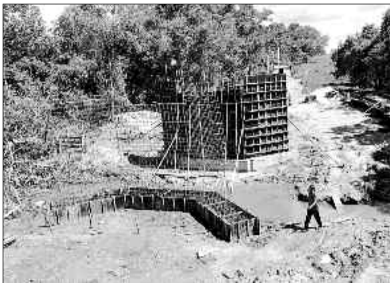
Prefeitura inicia obras de mais uma ponte para atender moradores

De acordo com a assessoria de comunicação da prefeitura, essa é uma obra de grande porte, que faz parte do Programa de Adequação das Estradas Vicinais, garantindo mais segurança e