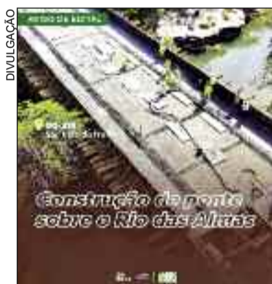
Obra tão esperada finalmente promete ser realizada na cidade

Valor total estimado da contratação: R$ 20.513.597,20. Contratação nº 105089, processo nº 202400005010129, sob o regime de execução de empreitada por preço unitário, Modo de disputa: aberto, sem inversão de fases, nos termos da Lei nº 14.133/2021, do decreto 10.359/2023 e demais legislação aplicável e, ainda, conforme as condições estabelecidas no Edital