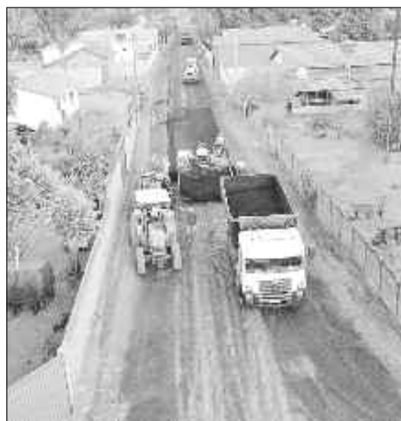
Prefeitura resgata mais um compromisso no local