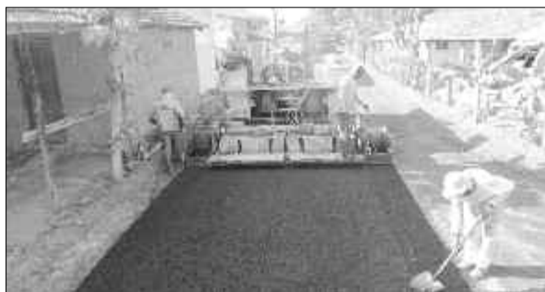
População do Cruzeiro comemora a chegada das obras pela prefeitura