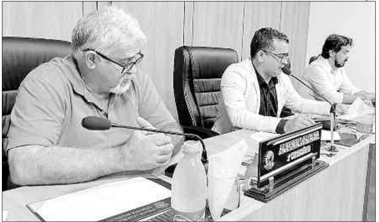
Vereadores de Campinorte discutem projetos e votações durante mais uma sessão ordinária na Câmara

As sessões ordinárias da Câmara de Campinorte refletem o compromisso do Legislativo em promover um debate construtivo e eficiente, visando sempre o bem-estar da comunidade. A continuidade de tais encontros é fundamental para o avanço das pautas que impactam diretamente a vida dos cidadãos. Lembrando que a comunidade pode e deve participar das sessões plenárias, que ocorrem sempre as quartas-feiras direto do plenário. A comunidade também podem acompanhar as sessões pelos canais oficiais da Câmara pelas redes sociais.