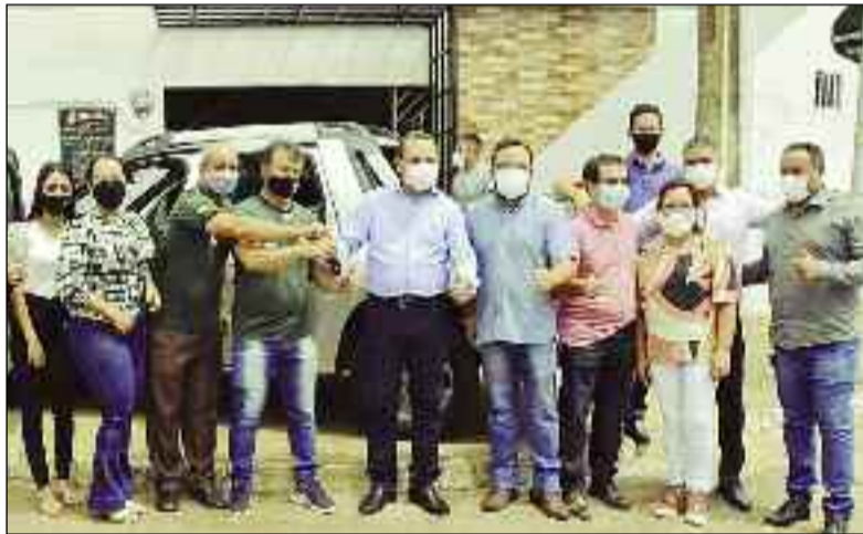
Adriano do Baldy visita município para realizar entrega de um veículo

pelo nosso município que é constituído de um povo íntegro e trabalhador e merece sempre o melhor. Sabemos das dificuldades, mas estamos firmes na luta sempre colocando os interesses de Rialma como foco principal", pontou o prefeito.