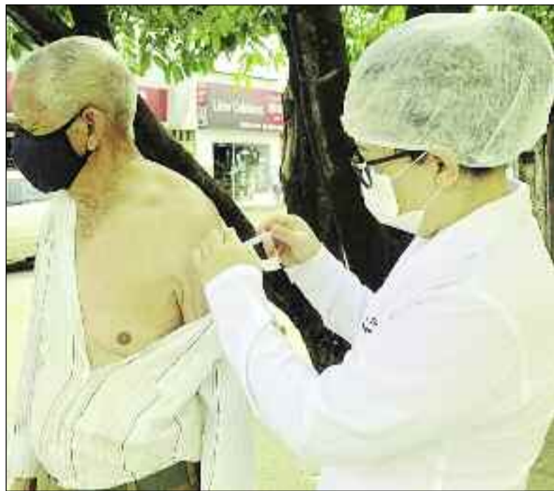
Com muito trabalho, município vira modelo no enfrentamento à covid