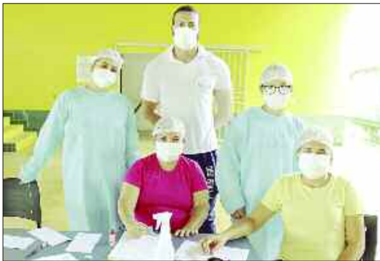
Profissionais têm se destacado pelo enfrentamento a Covid-19

"Gratidão imensa a todos os profissionais envolvidos no trabalho de imunização, prevenção e tratamento da Covid-19 em nosso município, pelo carinho e dedicação com que estão fazendo seu