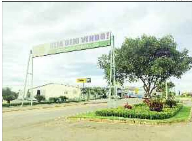
Cidade limpa e arborizada é uma das marcas da atual gestão