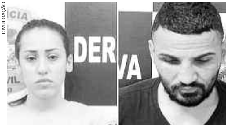
Casal foi detido e acusado de supostamente aplicar vários golpes

Segundo a investigação, no dia 20 de outubro do ano passa-