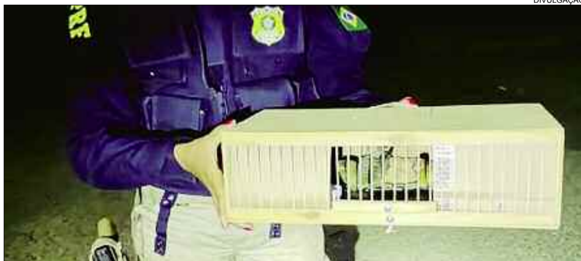
policiais recolhe aves dentro de compartimento em ônibus