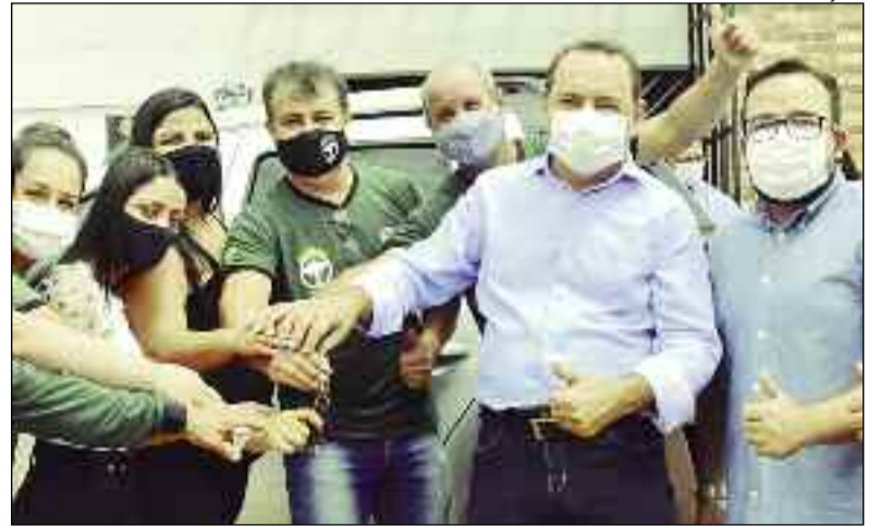
Deputado entrega chaves de carro para atender a comunidade local

"A Semana Pedagógica é um momento ímpar para rever toda a trajetória pedagógica vivenciada