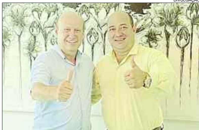
Alex Gas com o deputado federal Célio Silveira: trabalho de parceria

Desta vez, os recursos serão investidos na infraestrutura do município. Segundo o prefeito, muito em breve as obras serão iniciadas. "Agradeço ao deputado Célio da Silveira por ajudar a nossa cidade. Vale lembrar que o deputado sempre está nos ajudando. Temos muito a agradecer pelo trabalho. Fica nossa gratidão pelo empenho e dedicação por esse significativo benefício, que será de grande importância para nossa cidade", agradeceu o prefeito em nome de toda população Ipiranguense.