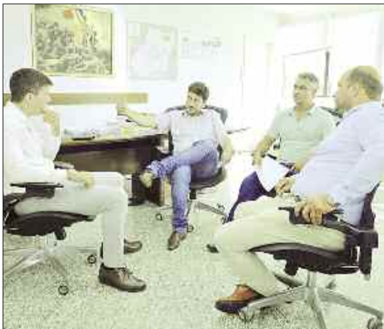
Reunião que busca benefícios para atender Ipiranga de Goiás