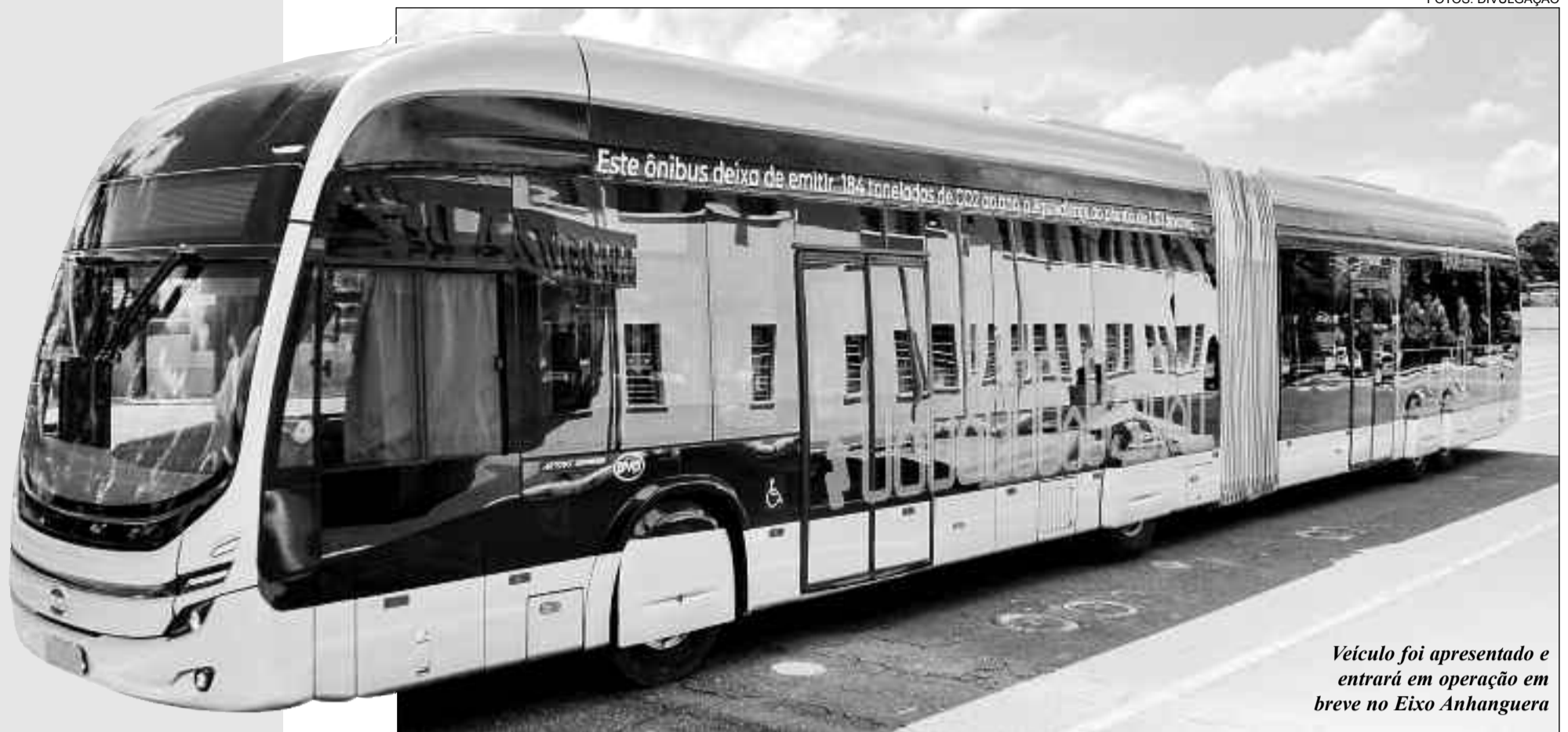
Veículo foi apresentado e entrará em operação em breve no Eixo Anhanguera

Iniciativa visa melhorar a qualidade do transporte coletivo dos trabalhadores que utilizam a rede de ônibus