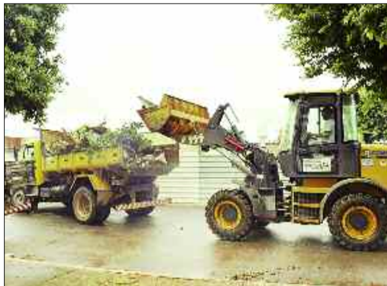
Trabalho contínuo para garantir uma cidade limpa todos os meses

de de internautas da região, atingindo mais de 20 mil seguidores.