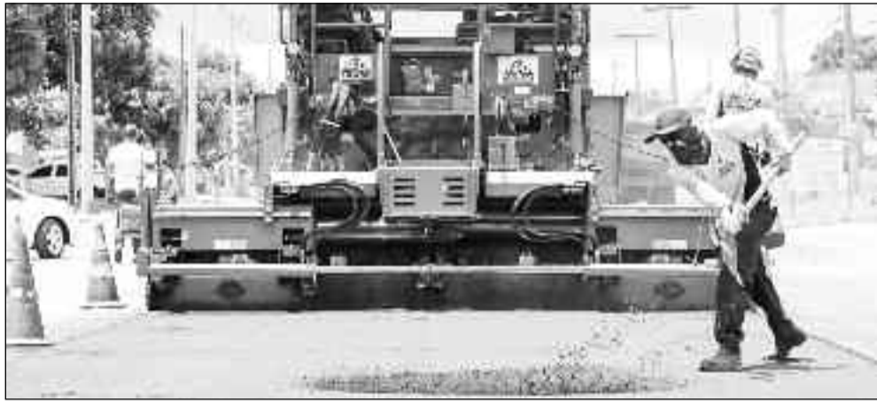
Trabalhos em vários pontos da cidade são rotina em Jaraguá: mais qualidade de vida