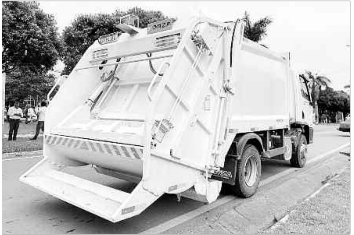
Caminhão já está servindo a comunidade de Itapaci: mais qualidade na prestação de serviços pela cidade