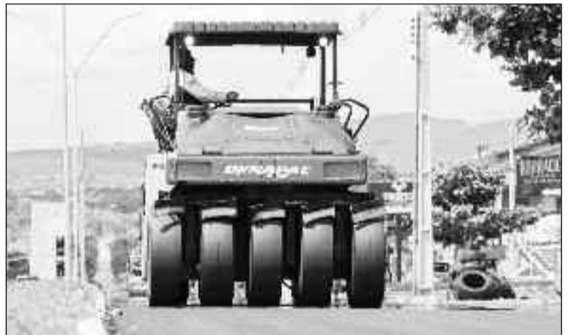
Parceria com governo garante recuperação de ruas e avenidas