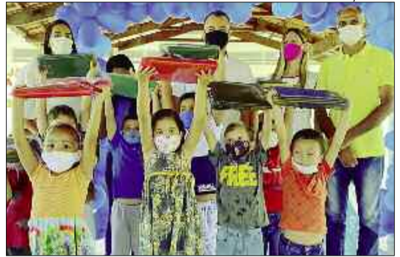
Crianças recebem novo material escolar. Prefeito participa do ato