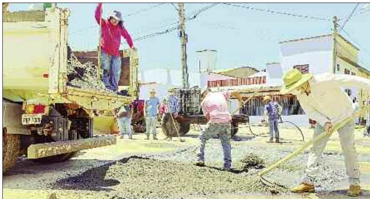
Equipes de trabalhadores trabalham muito para recuperar as ruas da cidade, prejudicadas pelas chuvas