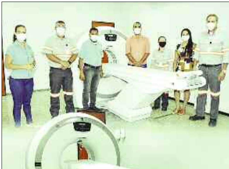
Parceria garantiu instalação de um tomógrafo no Hospital Municipal

A classificação foi divulgada amplamente nas redes sociais do município, tendo grande repercussão, tendo em vista a pujante gama de contatos, onde Alto Horizonte conta com a mais forte comunidade