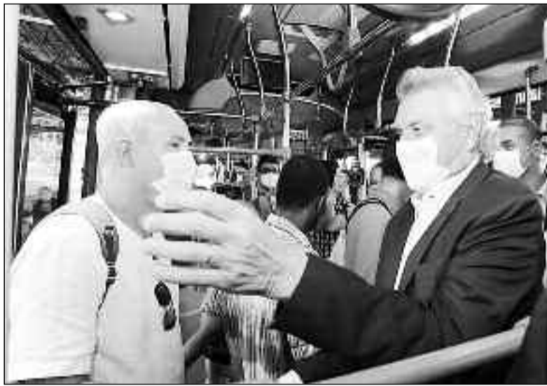
Governador Ronaldo Caiado circulou no veículo elétrico em Goiânia

Ao todo, serão mais de 100 novos ônibus para substituir a atual frota, composta por 86 unidades. O veículo, que passa a integrar um estudo de viabilidade técnica e econômica, é produzido pela montadora chinesa Build Your Dreams