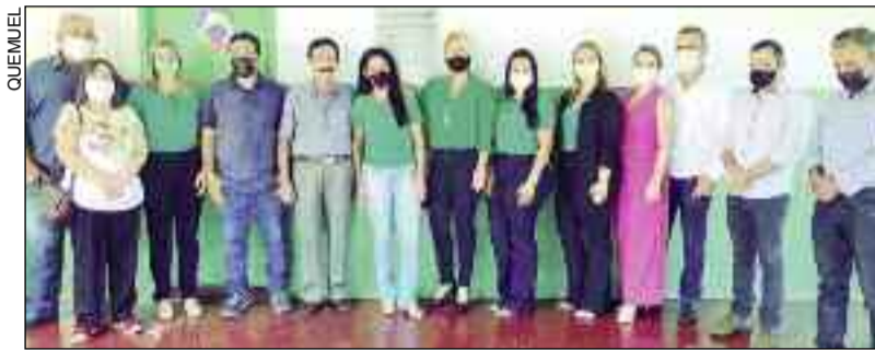
Solenidade e inauguração de reforma de escola em Carmo do Rio Verde

Na oportunidade, também foram entregues 20 computadores para o laboratório de informática da escola, uma antiga reivindicação que está sendo resgatada pela atual gestão. Lembrando que os aparelhos foram adquiridos através de emenda parlamentar do deputado Bruno Peixoto e contrapartida da prefeitura