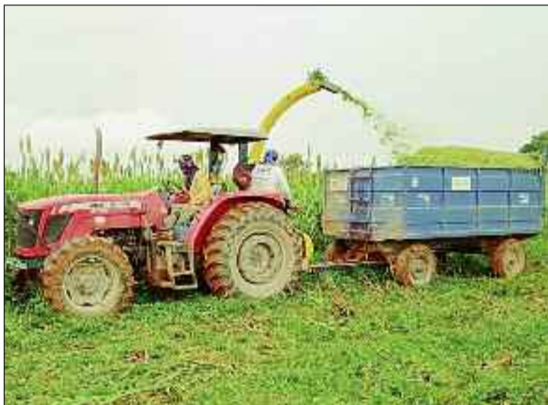
Apoio ao homem do campo garantido também todo o mandato