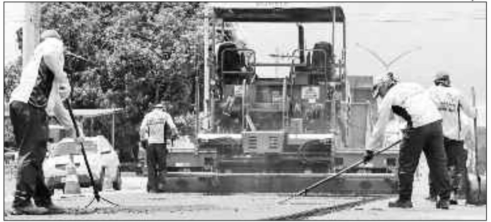
Funcionários trabalham em novo recapeamento para garantir melhor trafegabilidade