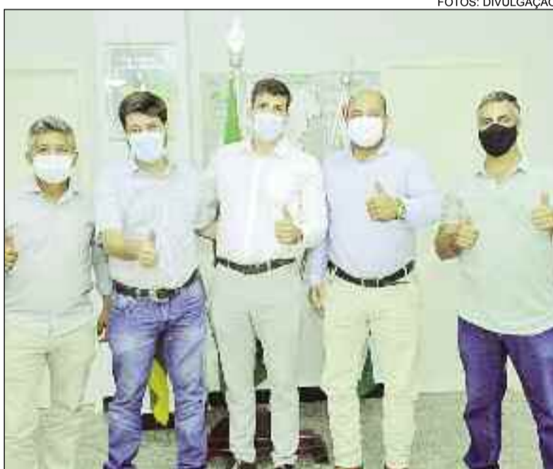
Em Goiânia, prefeito busca parceria para Ipiranga e toda região