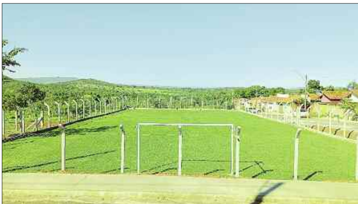
Espaços para prática de esporte são comuns na cidade de Uruana, considerada a capital da melancia