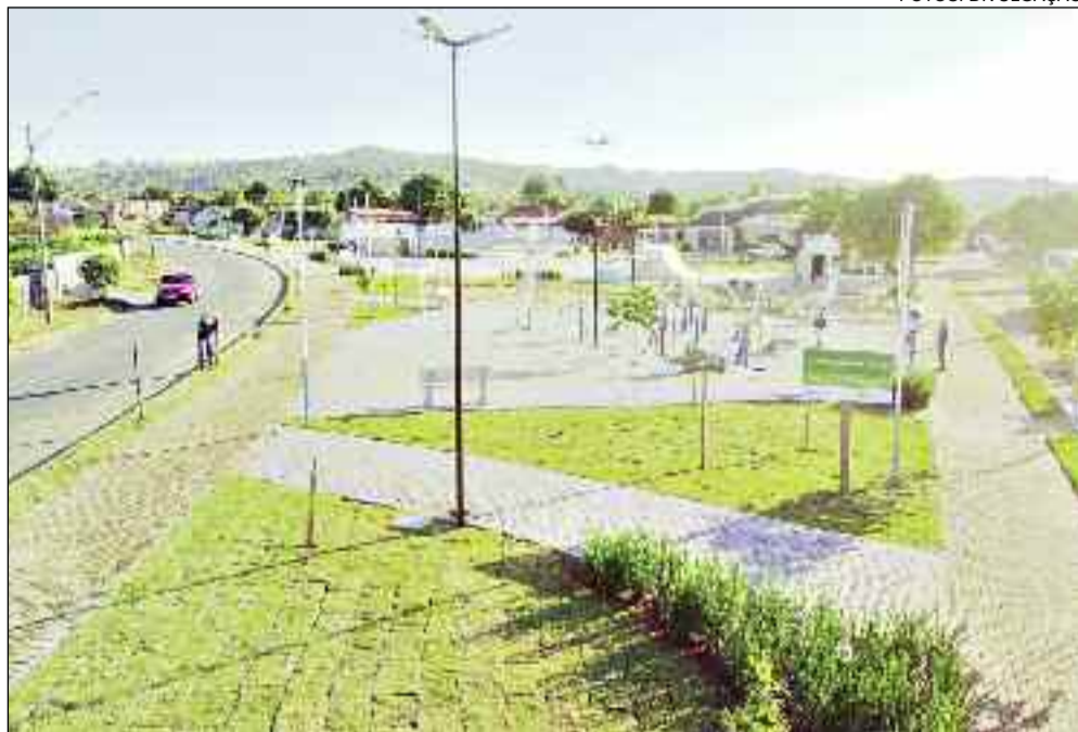
Espaço que assegura mais qualidade de vida à população e garante também mais saúde