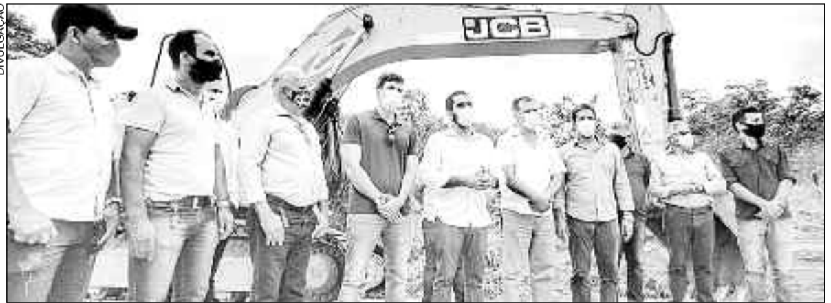
Lincoln Tejeta com autoridades visitam o canteiro de obras na GO-336, entre Crixás e Nova Crixás

O vice-governador Lincoln Tejeta comemorou, em suas redes sociais, o anúncio da licitação para conclusão da pavimentação e restauração da GO-336, entre Crixás e Nova Crixás, publicado no Diário Oficial do Estado nesta segunda-feira (12). Esta é uma demanda antiga da população que vive no Norte goiano e que transita pela rodovia. As obras, que serão realizadas pela Agência Goiana de Infraestrutura e Transportes (Goinfra), vão começar em breve.