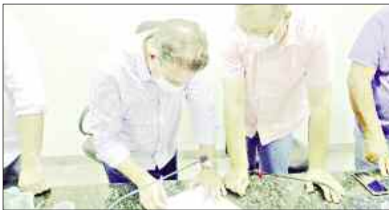
Senador assina documento para destinar novos benefícios a Uruana