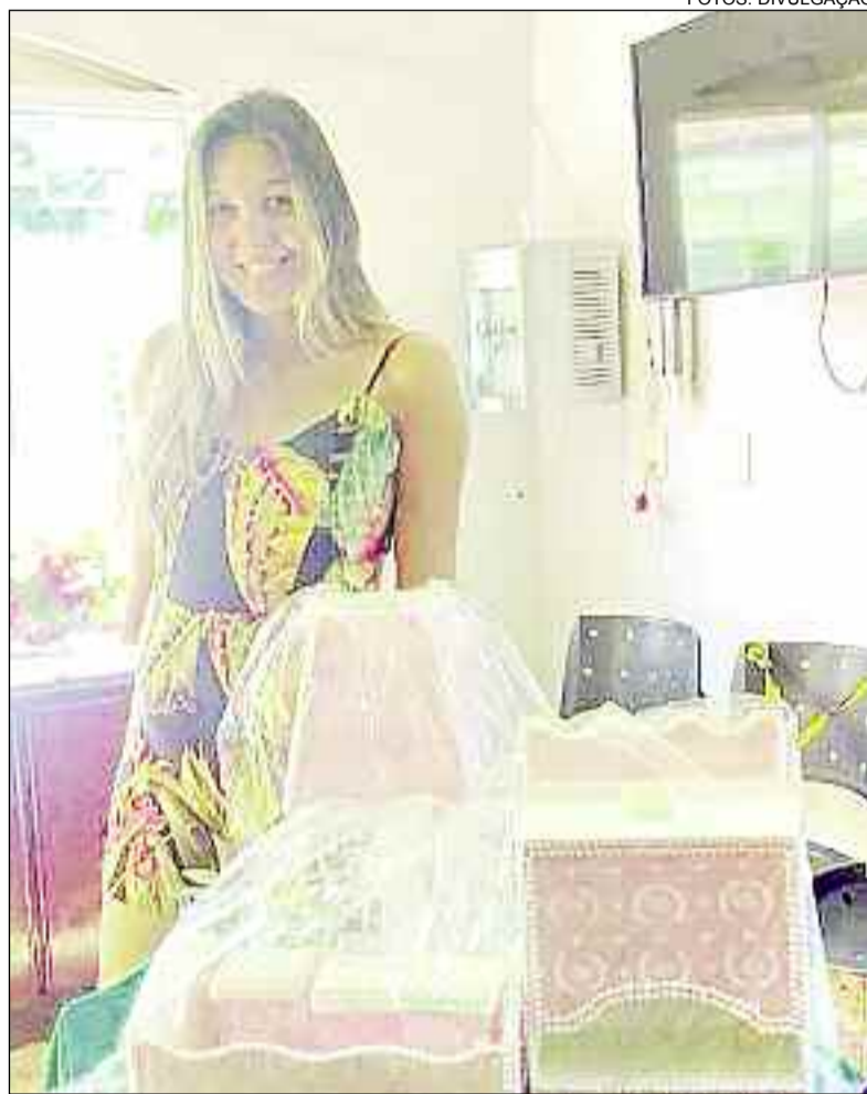
Gestantes aprendem em curso como lidar com a gravidez e os bebês

Dentre os itens que serão criados, destaque para mantas, que serão usadas no cuidado das crianças. O trabalho é feito com Patch Aplique e o porta-cartão de vacina, por exemplo é todo decorado com EVA. De acordo com as profissionais do CRAS, o objetivo é auxiliar as gestantes a aliviarem preocupações, dúvidas, inseguranças e medos. "Ao participarem dos encontros, as futuras mães podem trocar experiências e amenizar preocupações que cercam essa fase da vida", dizem.