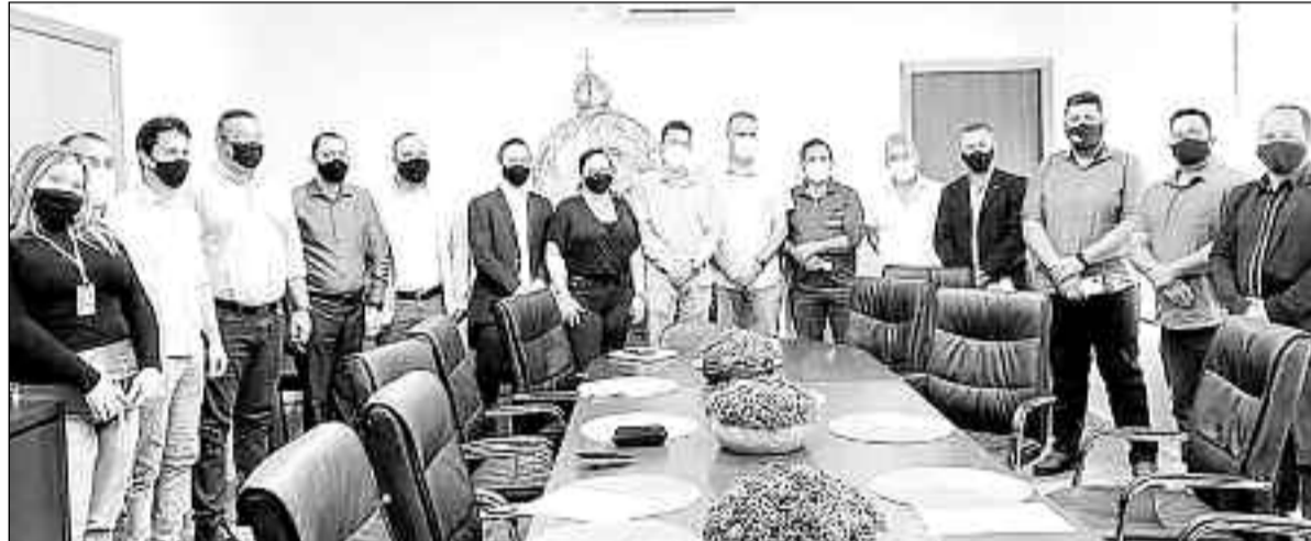
Gestores e secretários da região unidos em prol do turismo: uma nova possibilidade para gerar empregos