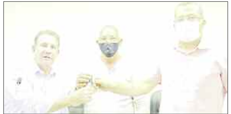
Prefeito recebe das mãos do senador as chaves do novo maquinário