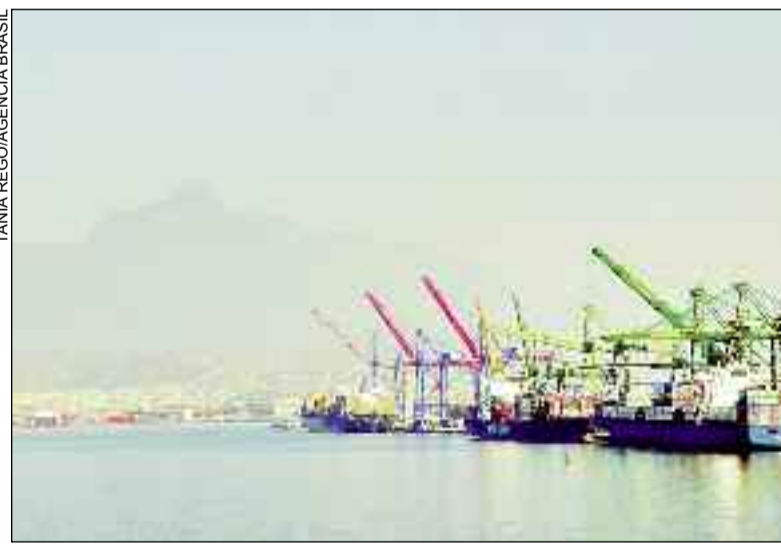
Atracação de navios no Cais do Porto do Rio de Janeiro: mais recursos

Quanto ao superávit, Castro disse que, se for confirmado, constituirá novo recorde, superando o recorde de 2017, de US$ 67 bilhões. A corrente de comércio, projetada em US$ 472,103 bilhões para 2021, ficará próxima do recorde atual de US$ 482,292 bilhões, apurado em 2011.