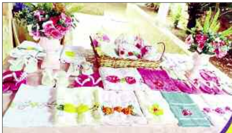
Material confeccionado pelas mães ajudam a montar o enxoval