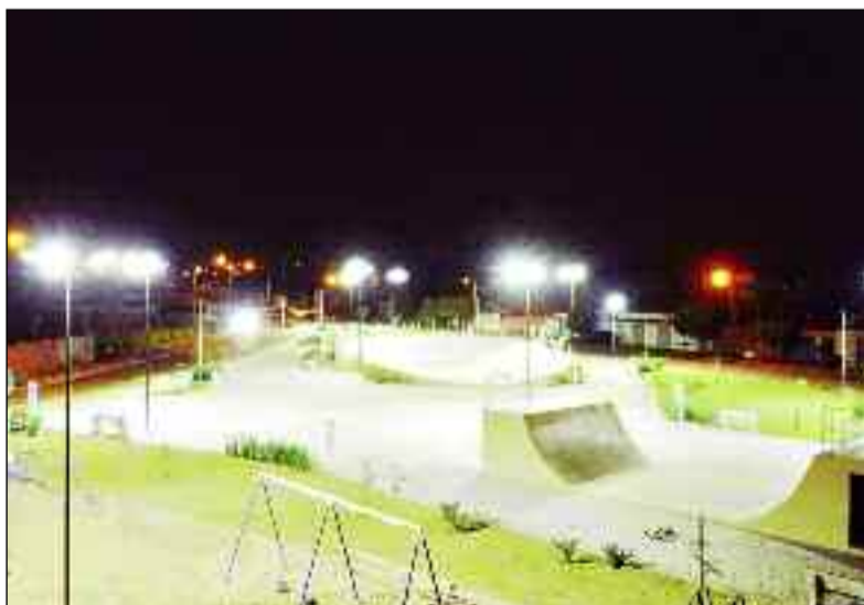
Beleza e estrutura adequada para atender a população de Itapaci