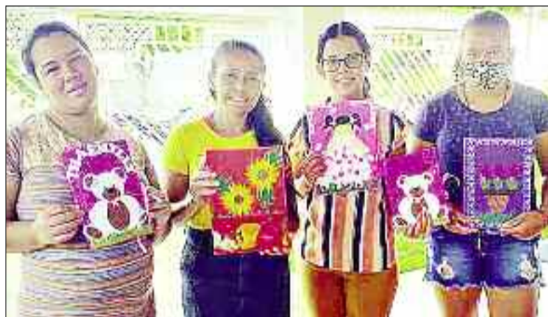
Trabalho de acompanhamento que tem resultado: apoio às mães