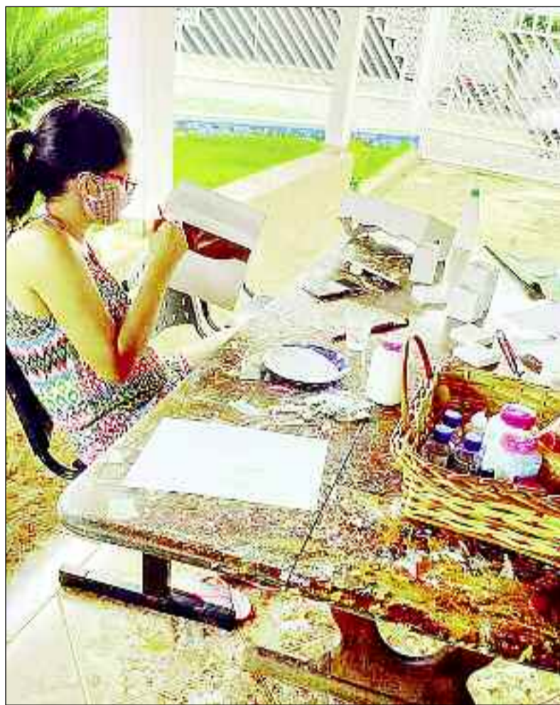
Futura mamãe participa de curso oferecido pela Prefeitura de S. Isabel

Iniciativa visa ajudar as futuras mães na confecção dos enxovais para os seus futuros bebês: saúde