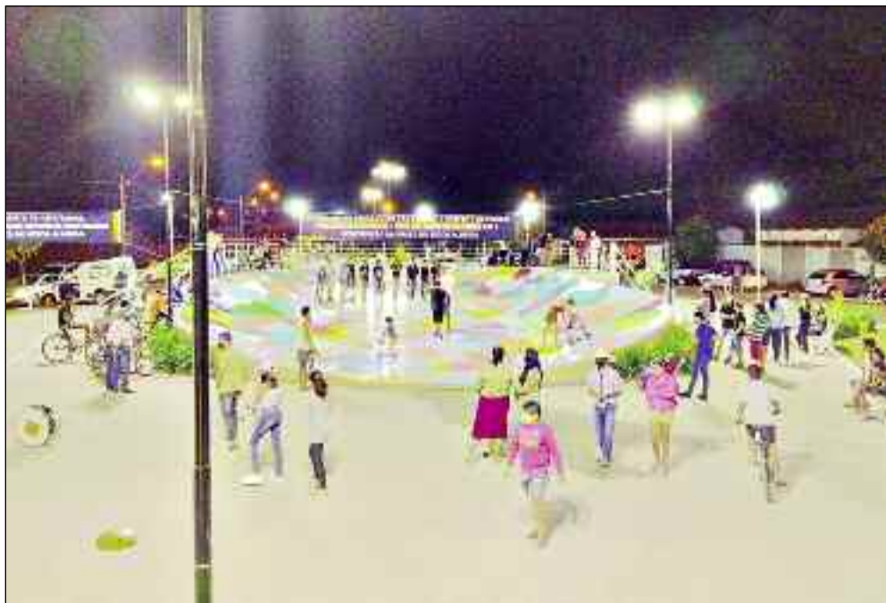
Espaço de lazer é o novo cartão postal da cidade de Itapaci: sempre à frente das demais