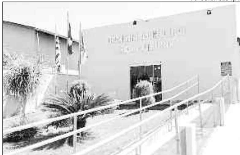
Fachada da Câmara está passando por reformas: melhor atendimento

essas melhorias, graças ao trabalho de economia e apoio de todos os vereadores. Fazemos questão de acompanhar as obras e fiscalizar a aplicabilidade de cada centavo do dinheiro público", explica o presidente.