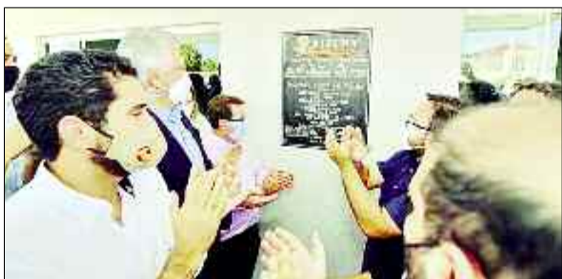
Momento mais esperado: descerramento de placa de inauguração

O vice-governador Lincoln Tejeta comemorou as entregas e falou da atuação junto a Caiado para que os benefícios cheguem à população. “Tenho a satisfação de dizer que eu sou vice-governador desse homem. Somos detentores de um sentimento só: estamos aqui para servir o povo de Goiás”, ressaltou Tejeta.