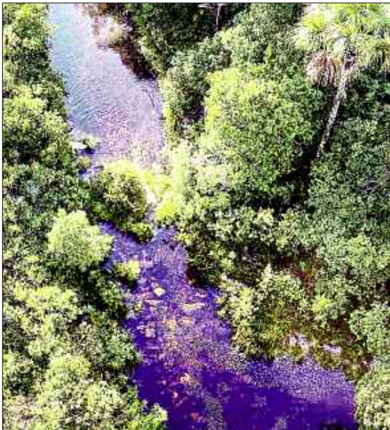
Chapada dos Veadeiros em Goiás: local de intensas visitas