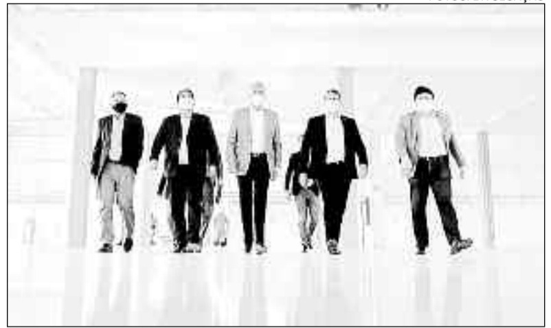
Autoridades visitam o espaço em Anápolis: força às ferrovias

O CETF deve começar a operar ainda neste ano. A criação é fruto da articulação do Governo