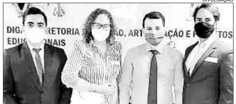
Em Brasília, comitiva busca viabilizar recursos para creche na cidade