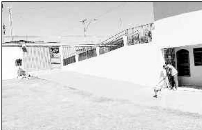
Últimos retoques nas obras da Câmara Municipal estão sendo executados

feita uma nova pintura, e adequações na estrutura do prédio, "que também é cedido para outros eventos da comunidade e precisava muito das adequações", afirma. "Graças a Deus estamos conseguindo realizar