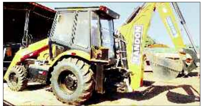
Maquina já está realizando trabalhos em prol da comunidade local