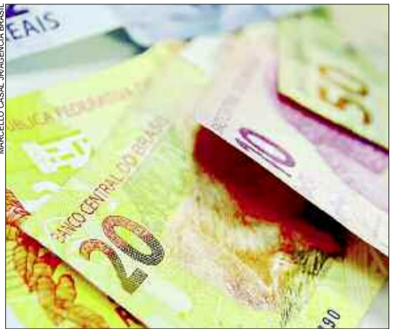
Governo espera aumento de arrecadação com as novas medidas

A perda de receita será compensada com a reintrodução da alíquota