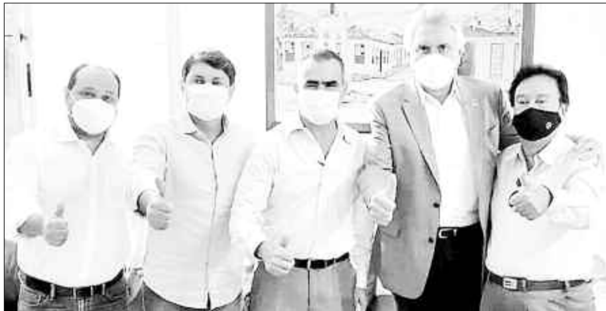
Comitiva de Carmo do Rio Verde com o governador Ronaldo Caiado: parcerias e mais benefícios à cidade