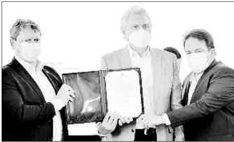
Ministro Tarcísio, governador Ronaldo Caiado e o prefeito Roberto

“Vamos formar as melhores cabeças para discutir o avanço das ferrovias Brasil a fora”, garantiu o governador. O complexo será implantado e mantido com recursos de concessionárias do setor, depositados em um fundo da Agência Nacional de Transportes Terrestres (ANTT).