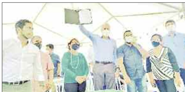
Governador apresenta documento em que autoriza novas obras