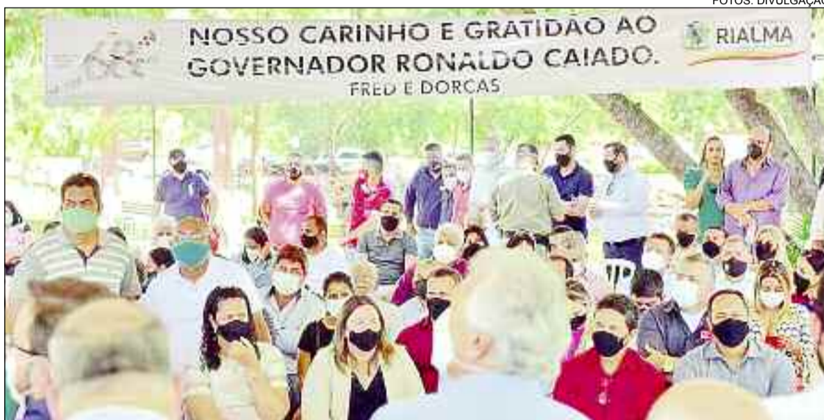
Governador e a comunidade de Rialma durante evento na cidade para comemorar os 68 anos de história

sendo comemorado com a entrega de obras e benefícios à população, advindos de recursos municipais, estaduais e federais, com a atuação dos deputados goianos. Entre os deputados estaduais presentes, Cairo Salim agradeceu Caiado pela parceria com a Assembleia Legislativa, a fim de devolver o Estado de Goiás aos goianos e fazer as reformas que são necessárias. “Como fiscal do povo, do seu governo, e legislador, tenho orgulho de dizer que eu assino embaixo as suas contas e tenho certeza de que o povo de Goiás está feliz com o que o senhor tem feito”, adicionou.