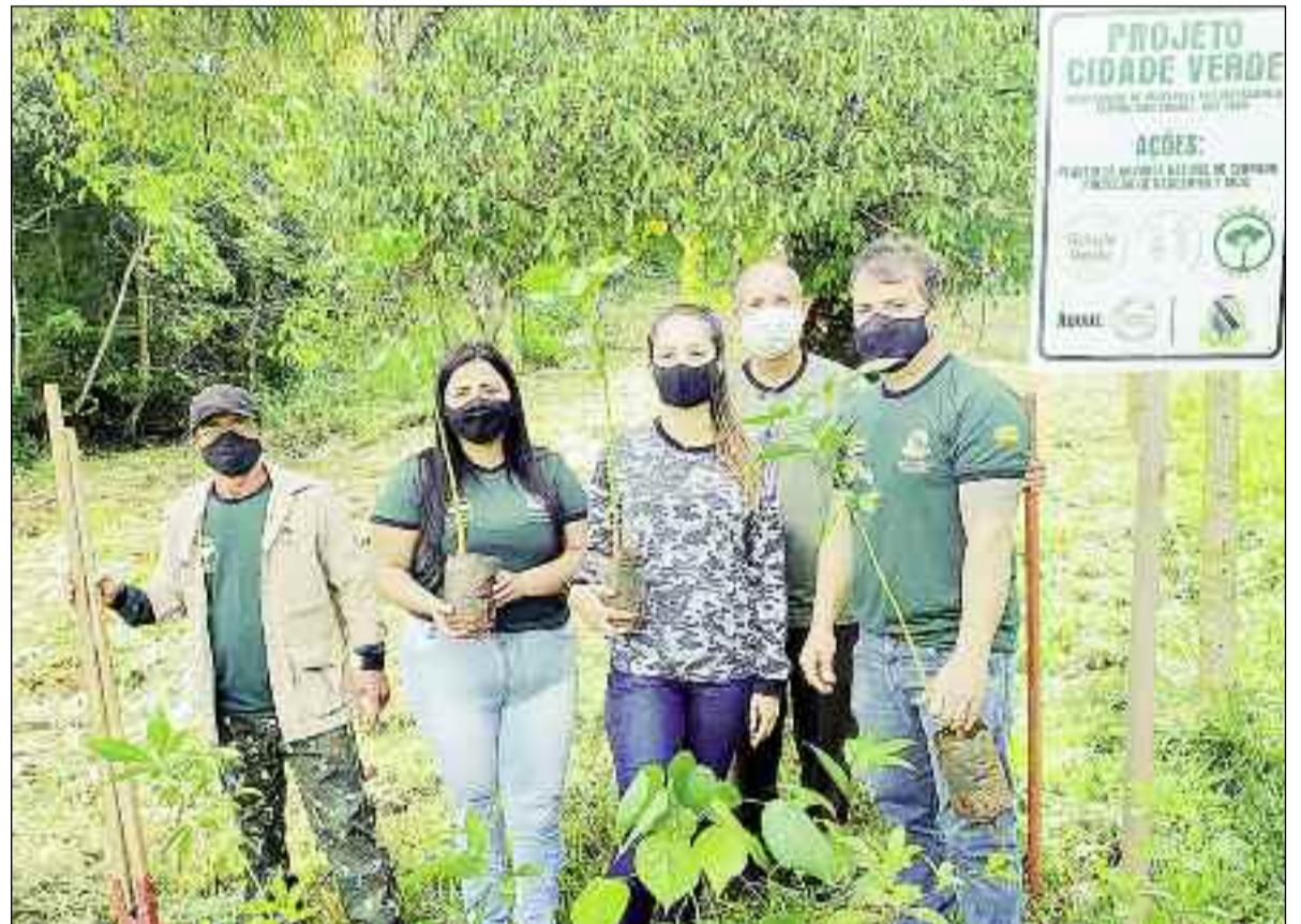
Agentes públicos na luta pela preservação do meio ambiente em Rialma: ação com reflexos para o futuro

tem se preocupado em construir um meio ambiente sustentável para as próximas gerações. O evento contou também com o apoio da Emater. Nesse programa, a SEMMAS disponibiliza apoio logístico e técnico para o dono de propriedade que queira recuperar sua nascente.