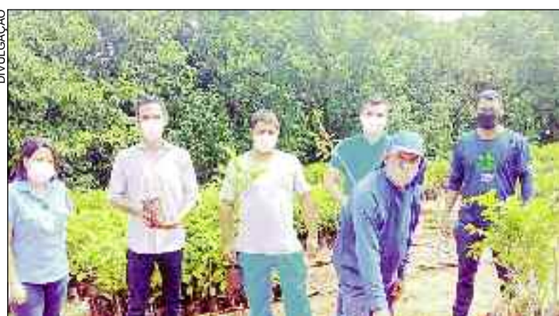
Empresa faz doação de mudas como meio de fortalecer meio ambiente

"Todos os setores da sociedade têm a responsabilidade quando se trata de proteção ao meio ambiente. Porém, as empresas precisam assumir liderança no que diz respeito a fornecer soluções para problemas ambientais. Elas devem agir para evitar qualquer tipo de poluição, e também para reforçar a proteção de recursos naturais. Estas atitudes devem considerar o