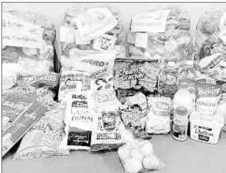
Alimentos que salvam vidas chegam em boa hora nessa pandemia

As doações podem ser feitas de duas formas: pessoalmente, com a entrega na sede da secretaria, ou