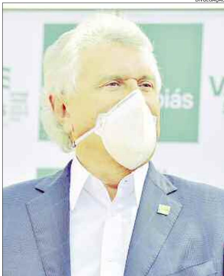
Medida de fechamento por 14 dias foi acionada para conter pandemia

"Com a abertura, dentro de um regramento mínimo, também não vai voltar festa, não vai voltar eventos. Esse processo é extensivo a todo o Estado de Goiás é um decreto que as prefeituras aderiram", salientou Caiado. O funcionamento das atividades econômicas e não econômicas deve seguir os protocolos expedidos pelas autoridades sanitárias, como uso de máscaras, disponibilização de álcool em gel para funcionários e clientes, manutenção do distanciamento entre pessoas e a proibição de aglomerações.