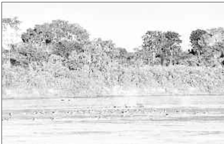
Rio Araguaia começa a baixar as suas águas e atrai muitos pescadores