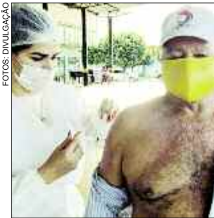
Idoso sendo vacinado em Alto Horizonte: medida contra a Covid

A vacinação contra a Covid-19 foi intensificada em Alto Horizonte no fim de semana. O atendimento realizado na sexta-feira (26) foi para os idosos na faixa etária 70-74 anos. O drive-thru aconteceu na Feira Coberta durante todo o dia. Moradores que compareceram ao local a pé também foram atendidos. A campanha tem sido divulgada em todos os canais de comunicação e os agentes comunitários de saúde também realizaram trabalho de informação à comunidade sobre os protocolos da vacinação.