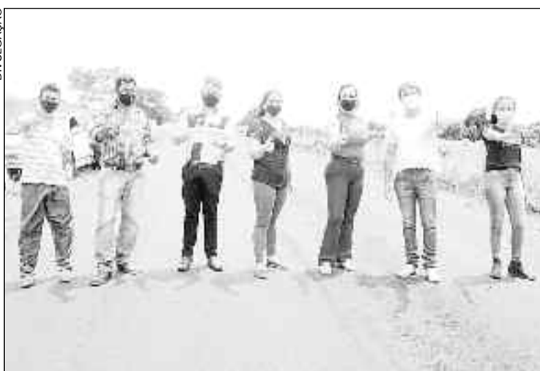
Prefeita e deputado e comunidade comemoram recuperação da GO

Em um vídeo postado nas redes sociais, a prefeita destacou o trabalho sério e transparente, "focado em ajudar e melhorar a condição de vida da nossa população,