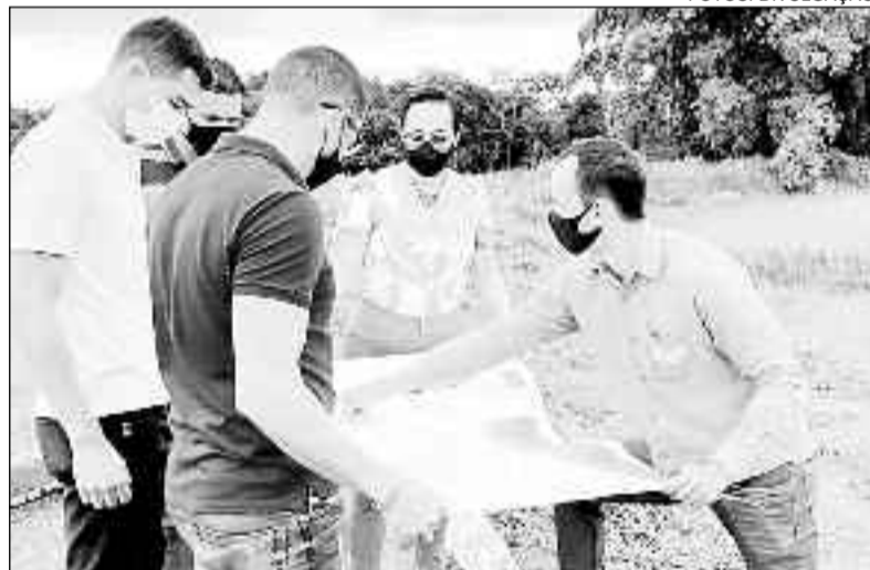
Segundo a prefeita, a obra assegura mais investimento e lazer

os que serão ampliados. "Como o período chuvoso está quase se encerrando, estamos nos preparando para o início dessa obra, que muito em breve será uma realidade para todos nós. Segui-