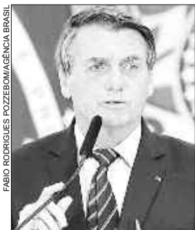
Novas medidas vem após um ano de pandemia e 300 mil mortes

De acordo com a Secom, o decreto prevê que o Comitê é composto pelo presidente da República, que o coordenará; pelos presidentes do Senado Federal; da Câmara dos Deputados; e, na condi-