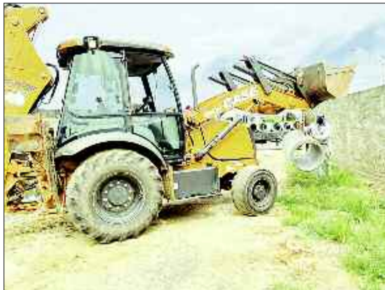
Estradas serão recuperadas com instalação de manilhas na zona rural

Com centenas de quilômetros de estradas vicinais, em muitas regiões o patrulamento não é suficiente, e para isso, se faz necessário a instalação de manilhas, o que vai garantir melhor os trabalhos de manutenção, uma vez que, é necessário a construção de bueiros e sistema de drenagens das águas. As obras com as manilhas