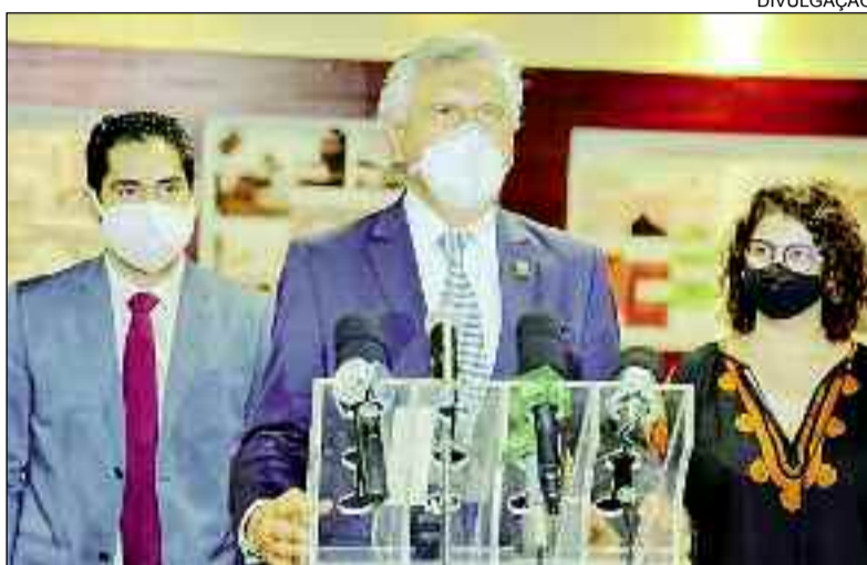
Tejota, governador Ronaldo Caiado e a secretária Andréa Vulcanis

O acordo, firmado na data em que se celebra o Dia Mundial da Água, representa mais um importante passo rumo à preservação de uma das principais bacias hidrográficas do Centro-Oeste, a Araguaia-Tocantins, e ainda potencializa o turismo local, a partir do aproveitamento racional e sustentável de toda a região. “Estamos avançando bem e conscientizando a popu-