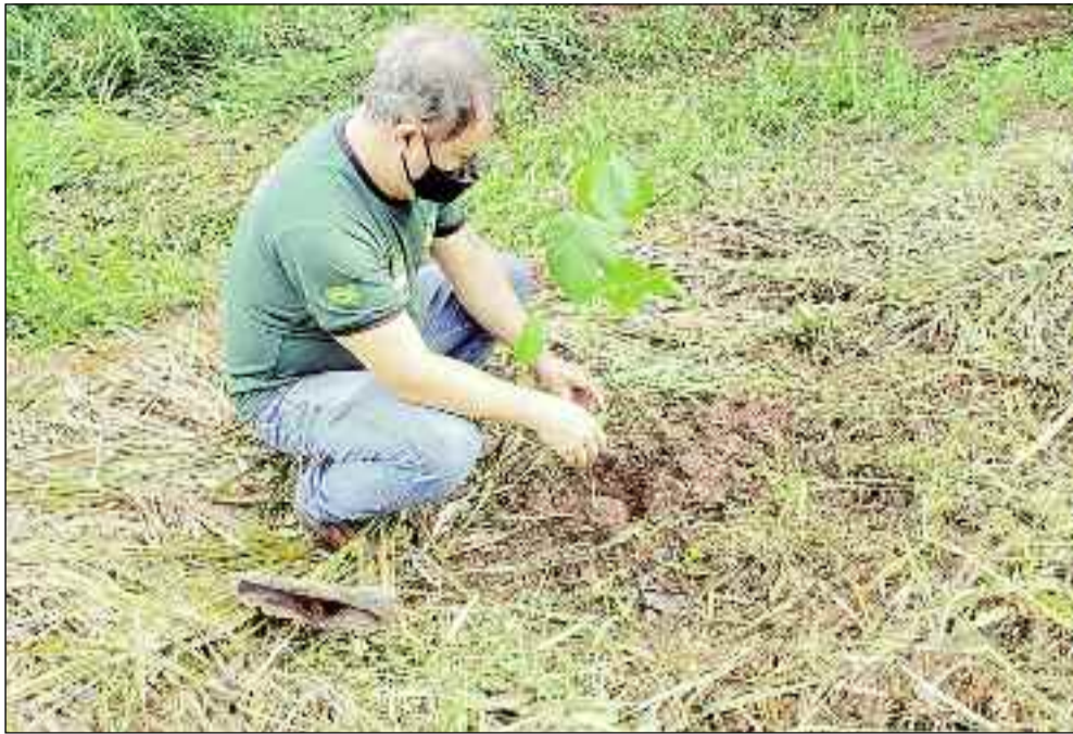
Ação promovida pela Secretaria de Meio Ambiente visa preservar nascentes do município