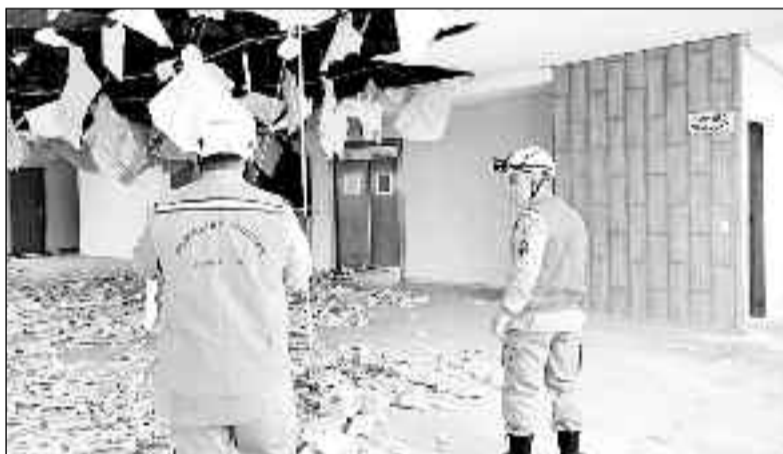
Corpo de Bombeiros fazem segunda vistoria para avaliar danos na obra