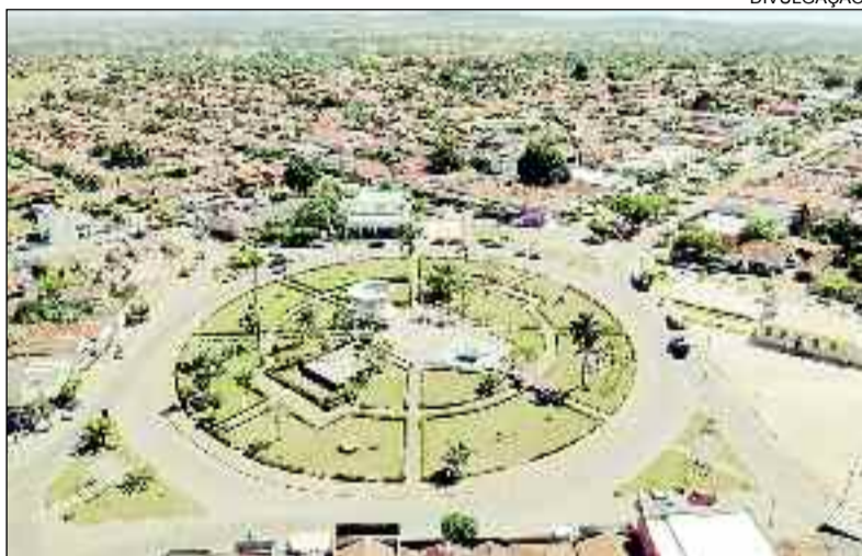
Cidade de Mara Rosa terá que fechar as atividades não-essenciais