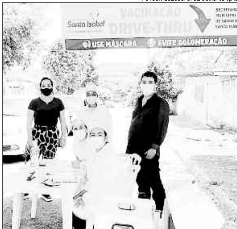
Posto de vacinação na cidade de Santa Isabel: mais saúde para idosos