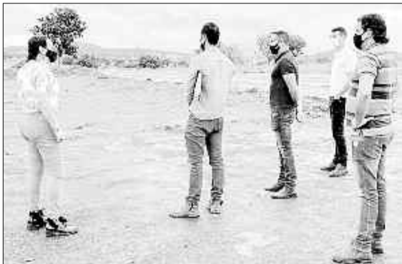
Prefeita visita local das obras acompanhada de engenheiro responsável

Um dos principais pontos turísticos de Santa Isabel, o Lago de Cirilândia, receberá melhorias em sua orla recreativa, com a ampliação do espaço de lazer, que contará com diversos benefícios para quem frequenta as dependências do local, por exemplo uma rampa para acesso de Jet Ski e muito espaço de lazer. Os valores que garanti-