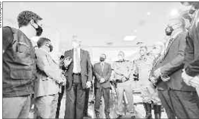
Governador Ronaldo Caiado durante ato para anúncio das medidas

O documento foi publicado, em edição extra do Diário Oficial do Estado, na quarta-feira (24/03), por determinação do governador, após