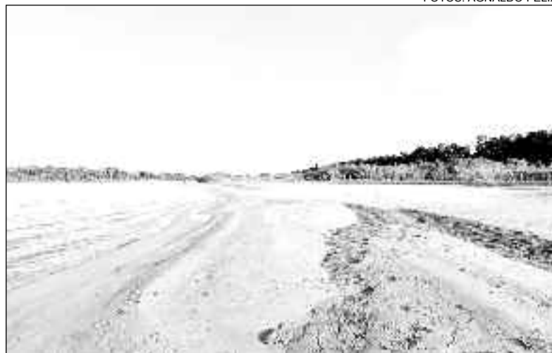
Governo quer evitar aglomerações no Araguaia durante a semana santa