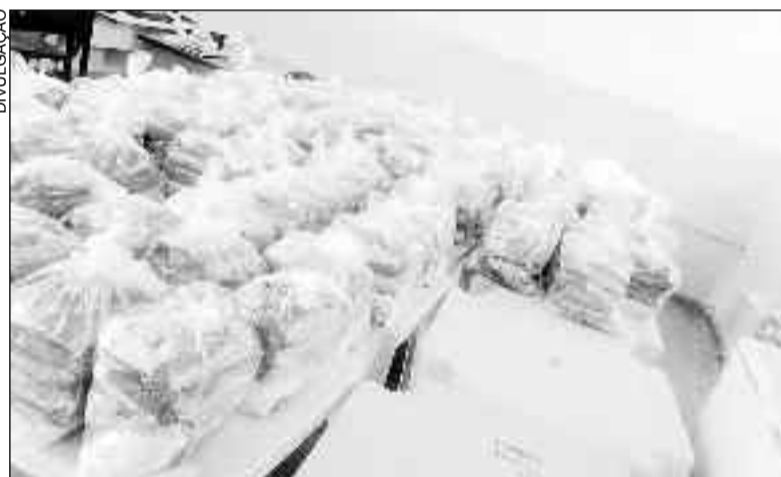
Kits alimentação serão entregues para alunos da rede de ensino estadual

Com a suspensão das aulas presenciais devido a Covid-19, a merenda escolar foi substituída pela entrega de alimentos aos alunos. Os kits são compostos por 2kg de arroz (tipo 1), 1 kg de feijão (tipo 1), 1 molho de tomate de 340 g, 1 kg de macarrão e 3 kg de frutas, verduras e legumes variados.