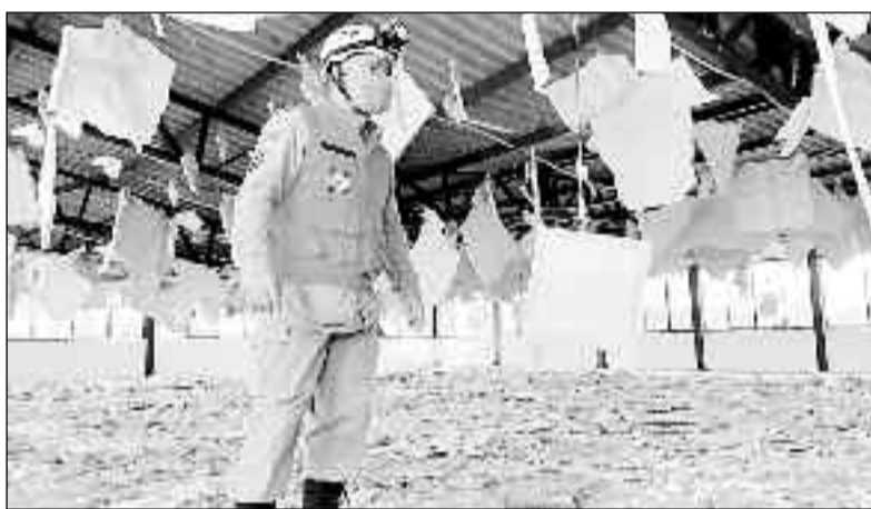
Defesa civil vistoria Clube que teve teto desabado: dinheiro no ralo