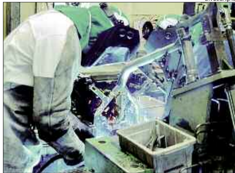
Montadora quer evitar novos casos da doença e paralisa atividades