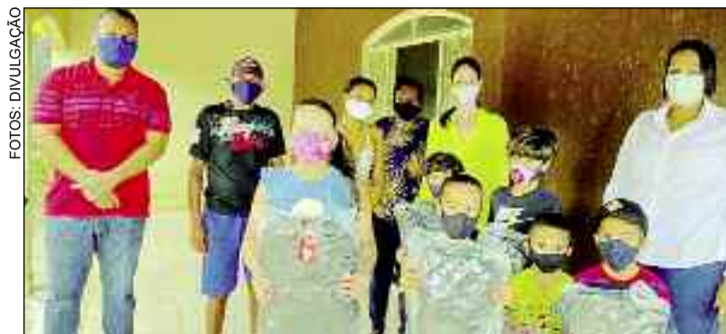
Prefeito com pais de crianças que receberam o material escolar

com a escola. "Agradecemos a toda equipe de profissionais da educação e a todos os que contribuíram pela melhoria da educação municipal", disse.