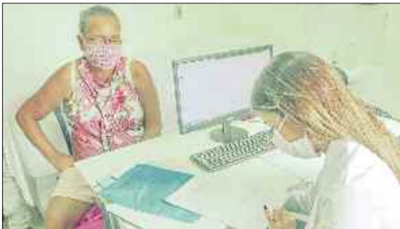
Moradora recebem atendimento em Nova América: zelo com a saúde