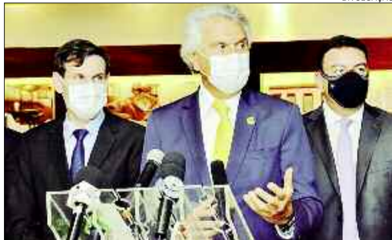
Governador Caiado ao lado de Lissauer Vieira e José Vitti: empregos

O balanço positivo reflete diretamente as ações desenvolvidas pelo Estado durante a pandemia. O secretário de Indústria, Comércio e Serviços, José Vitti,