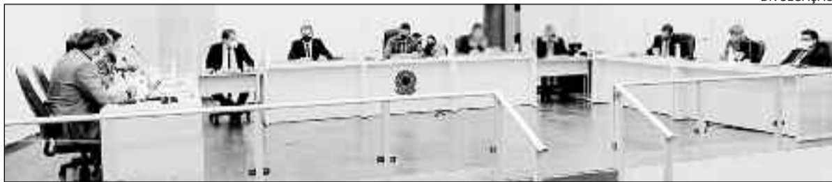
Trabalhos na Câmara Municipal de Ceres são retomados: muito trabalho e projetos para serem votados