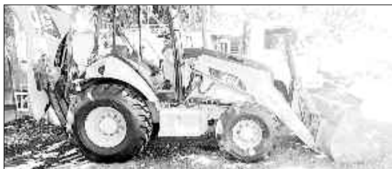
Trator da prefeitura recebe atenção adequada em Rianópolis