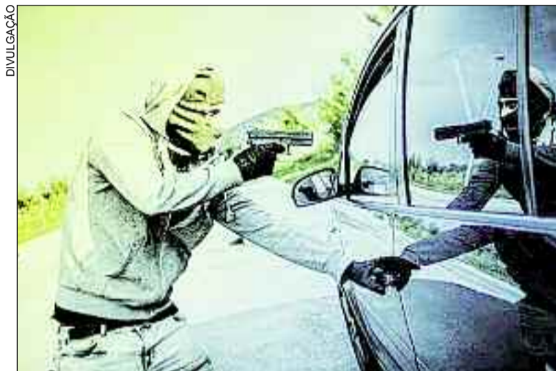
Roubo de veículos em Goiás tem queda importante: mais segurança

Com a diminuição expressiva, a média diária de roubos de veículos em Goiás passou de 27,7 casos em 2018 para 6,9 no último ano. Se levados em conta os registros de 2020 com os de 2019, a redução foi de 40,2%. Os números revelam uma mudança drástica no cenário da segurança pública em