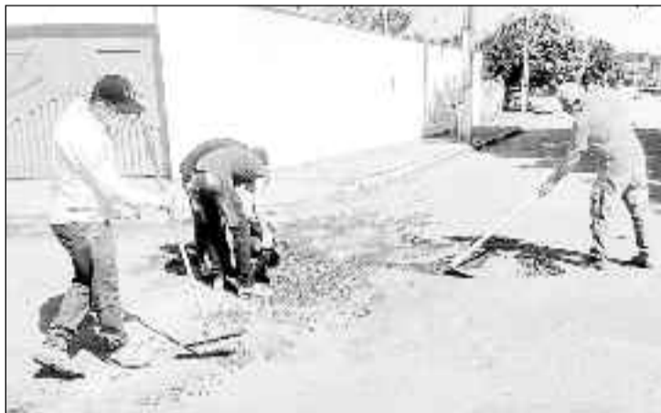
Equipes da prefeitura trabalham para tapar buracos nas ruas