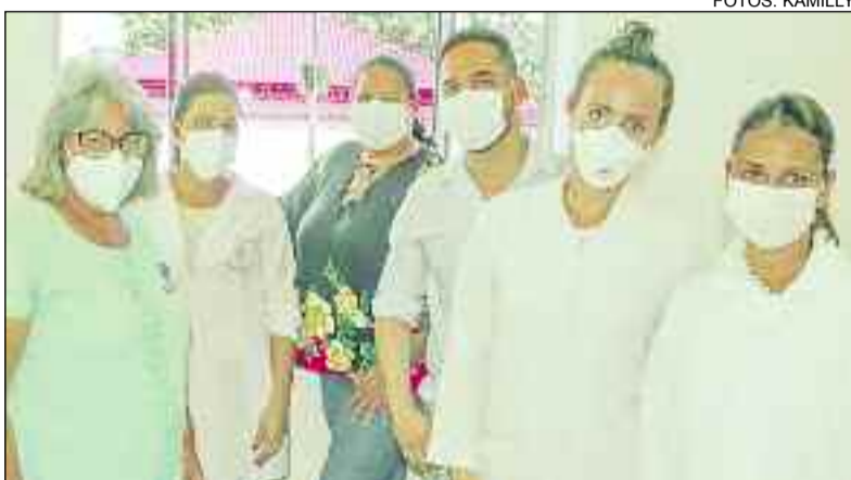
Equipe da área da saúde recebe orientações para combater a Covid