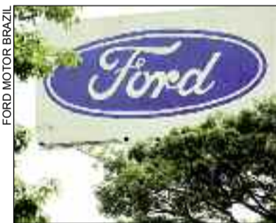
Ford decidiu fechar suas fábricas no Brasil e agora demite em massa