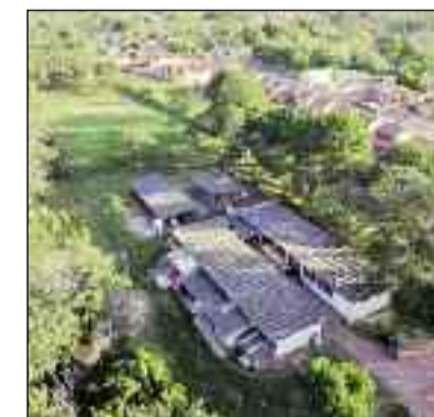
Mara Rosa será contemplada com um grande investimento

preço do de US$ 1.730/onça e dólar cotado a R$ 5,30. A vida útil inicial da mina será de 10 anos, com produção inicial de 104 mil onças de ouro por ano.