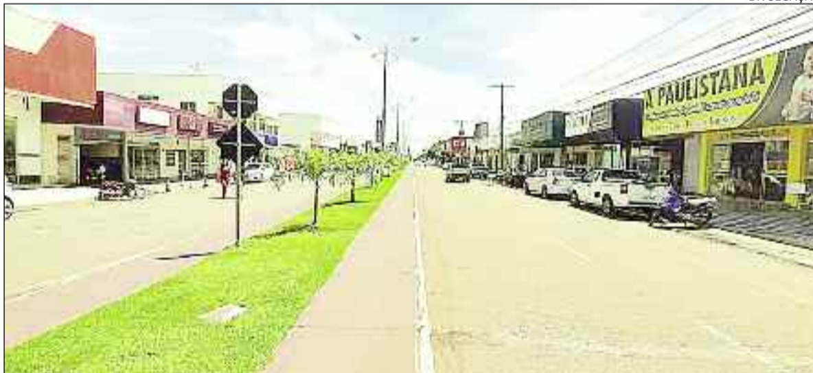
Empresários vinham se reunindo e correndo risco de contrair ou transmitir covid: prefeitura teve que agir

A Prefeitura de Porangatu notificou a ACIAP - Associação Comercial, Industrial e Agropecuária de Porangatu, por meio de ofício, na segunda-feira (1), proibindo a realização das reuniões matinais nas empresas do município, denominadas Cafés Empresariais. O descumprimento do ofício, segundo informou a Associação Comercial Porangatuense, prevê penas de aplicação de multas. As alegações