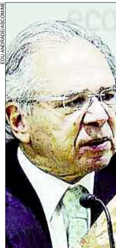
Ministro da Economia, Paulo Guedes, descarta ajuda aos pobres

Ao comentar que a retomada do auxílio emergencial é importante, Pacheco disse ter se antecipado à reunião do colégio de líderes, ao discutir a questão com Guedes. O senador, no entanto, ressaltou que a recriação do benefício deve ser discutida observando as regras fiscais. "Obviamente com cautela, com prudência, com observância de critérios, para evitar que as coisas piorem", afirmou.