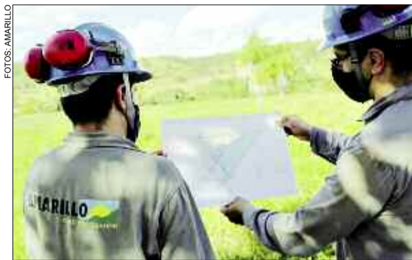
Mineradora está pronta para iniciar suas atividades em Mara Rosa

Mara Rosa (Mina de Posse) será composto por uma mina a céu aberto e operação de carbono em lixiviação, com empilhamento de rejeitos a seco. Um estudo de viabilidade definitivo divulgado em junho de 2020 mostrou que o projeto produzirá ouro a um custo de US$ 656 por onça, com base no