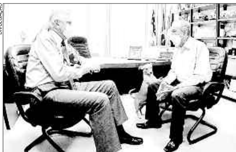
Governador Ronaldo Caiado com o ex-prefeito Iris Rezende: diálogos

A suspensão do feriado tem como objetivo evitar a ocorrência de aglomerações de pessoas, tão comuns no período carnavalesco, e, também, o descolamento de pessoas que buscam, principalmente, as cidades turísticas do Estado para passar a folia.