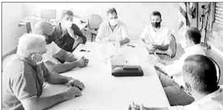
Reunião para discutir avanços nas cidades de Crixás e de Uirapuru