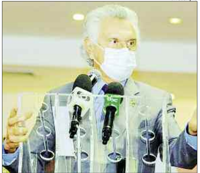
Governador Caiado quer acelerar ainda mais a vacinação no estado