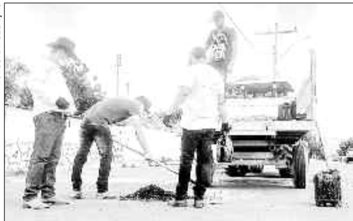
Objetivo é garantir segurança para os usuários das vias locais