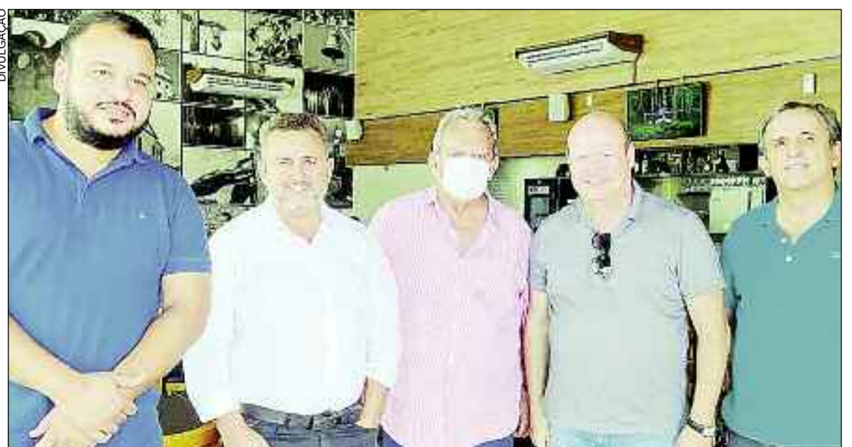
Prefeitos e secretários com deputado Célio da Silveira: parcerias para levar obras e benefícios às cidades