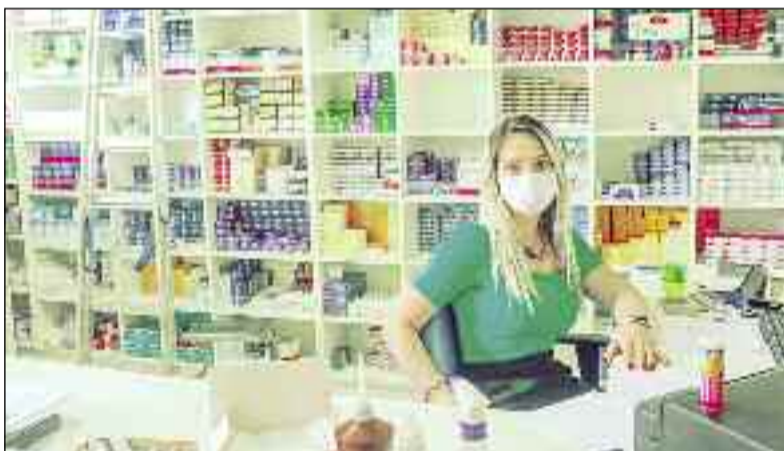
Farmácia pública abastecida para atendimento à população da cidade