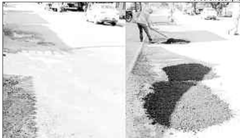
Ruas sendo devidamente recuperadas: compromisso de campanha