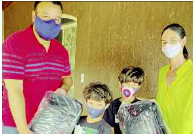
Prefeito e primeira-dama fazem a entrega de kits escolares na cidade