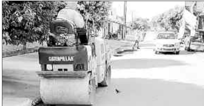
Homens e máquinas trabalham na recuperação de vias em Cirilândia