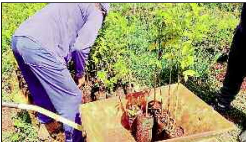
Mudas para melhorar o meio ambiente na cidade de Ceres: avanços