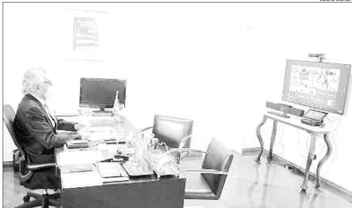
Governador Ronaldo Caiado durante live, oportunidade em que abordou a chegada de novas doses da vacina

Na live, o governador contou como foi a videoconferência com o embaixador chinês no Brasil, Yang Wanming, ocorrida nesta manhã. Na ocasião, Caiado e outros líderes que participam do Fórum de Governadores solicitaram à China o envio de mais insumos para a produção de vacinas contra