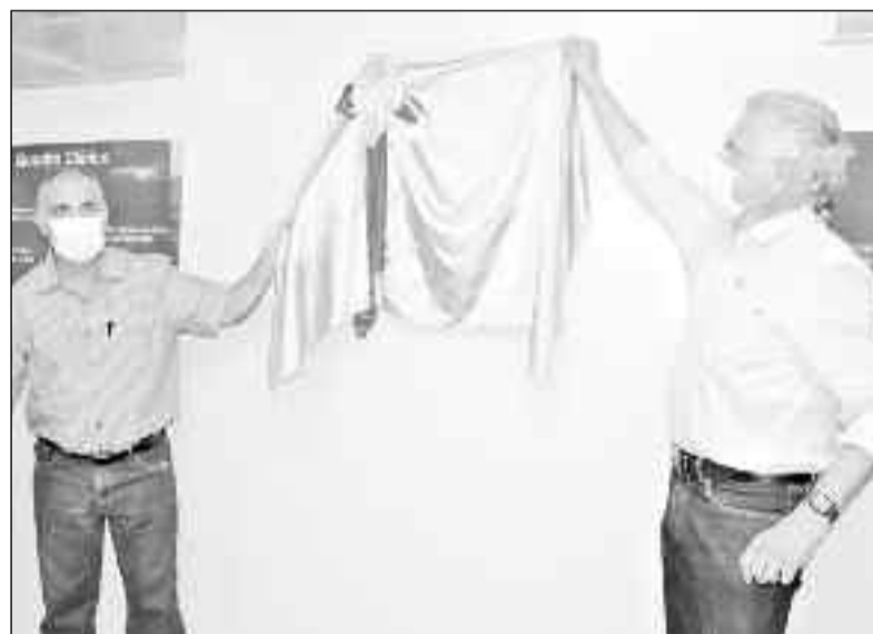
Momento solene da entrega da unidade de saúde em São Luiz do Norte

Com 19 leitos, capacidade para cinco mil atendimentos por mês e até 100 exames por hora, o hospital contou com investimento total