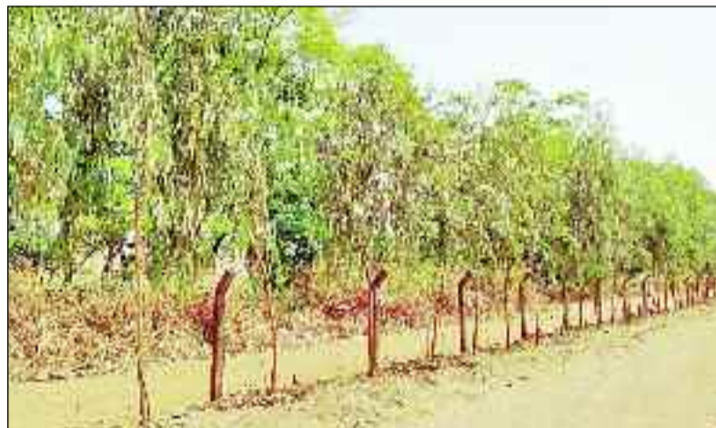
Iniciativa assegura mais qualidade de vida à população da região