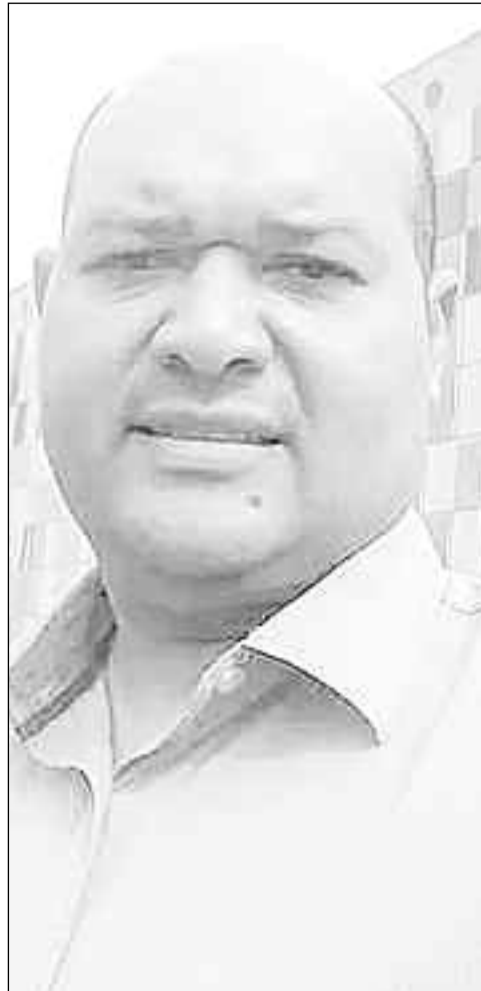
Sargento Ribeiro também tem baixa indicação de votos na disputa eleitoral