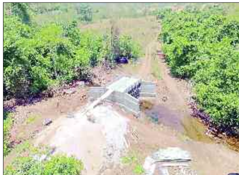
Em oito anos de gestão, foram quase 30 pontes entregues em Pilar