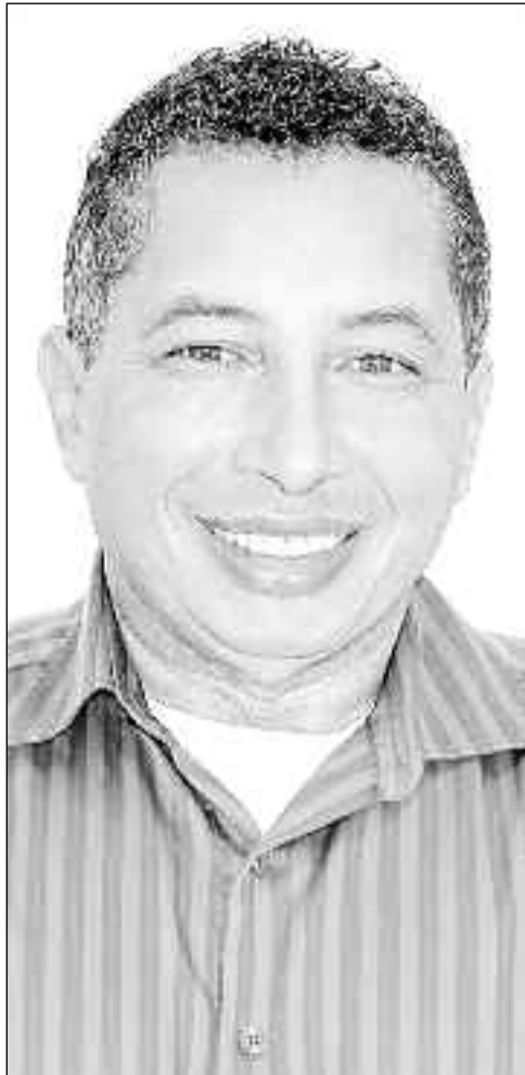
Borges caminha a passos largos para conquistar o seu quarto mandato