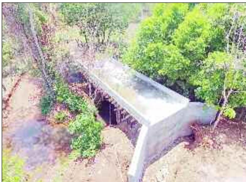
Obras atendem comunidade rural a escoar a sua produção agrícola