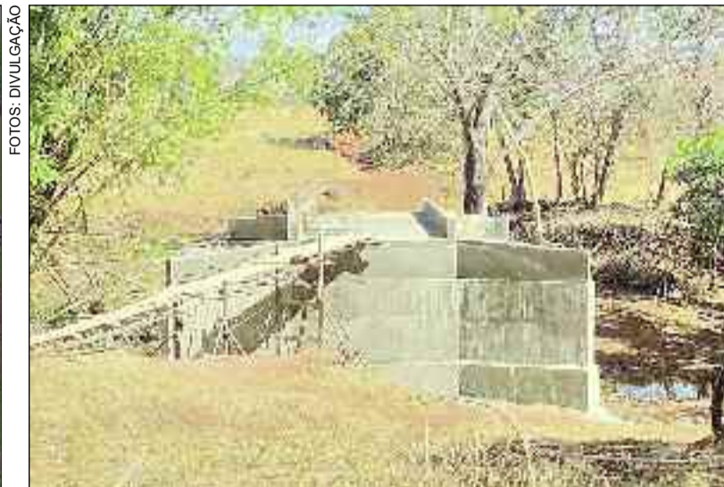
Mais cinco pontes estão em fase final de construção e serão entregues