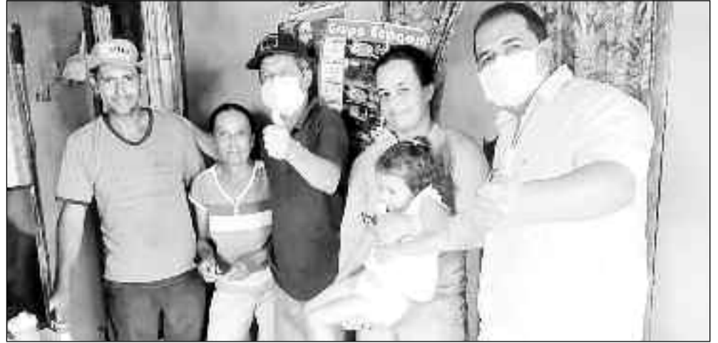
Rotina de visitas de casa em casa para conquistar apoio dos moradores de Pilar de Goiás