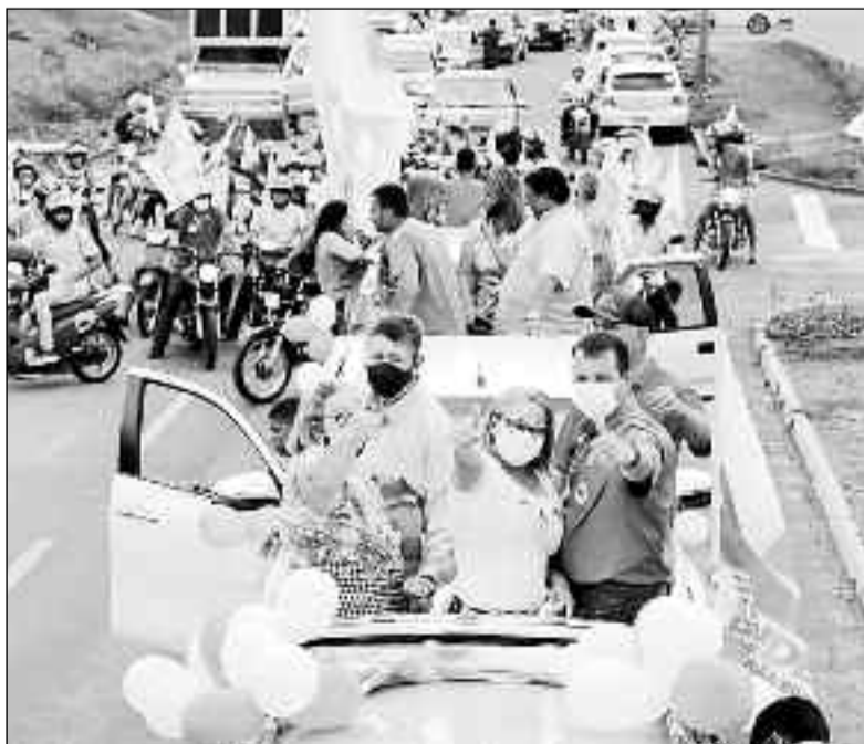
Candidatos nos carros durante carreata realizada no sábado na cidade