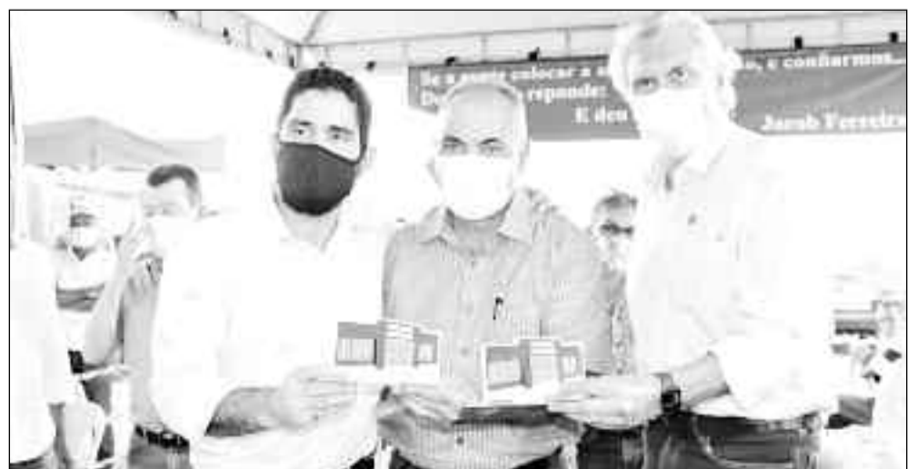
Expectativa de que unidade de saúde seja uma grande referência no Norte do Estado