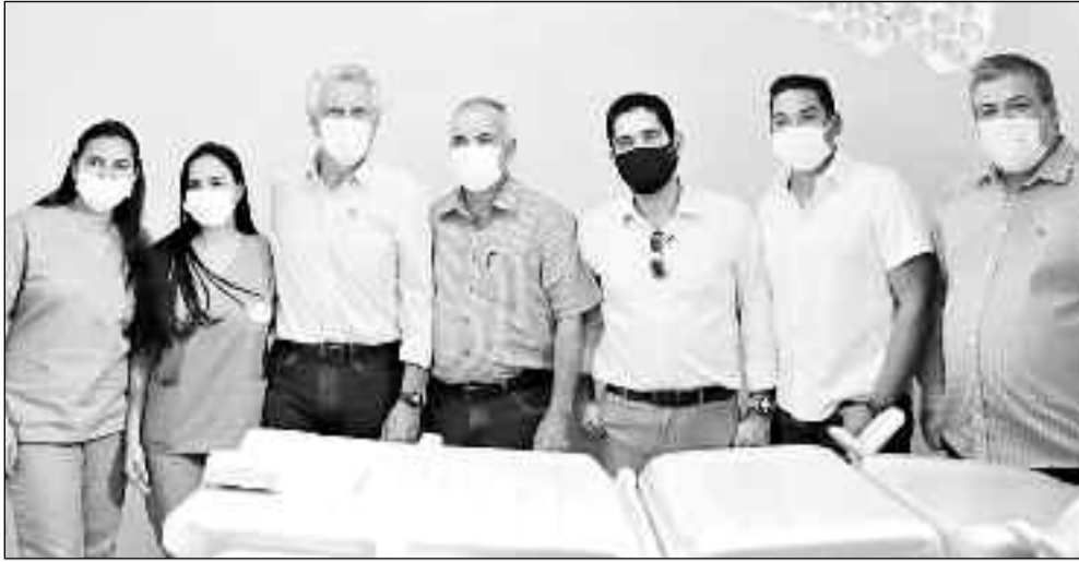
Profissionais e autoridades durante vistoria de hospital municipal em São Luiz do Norte