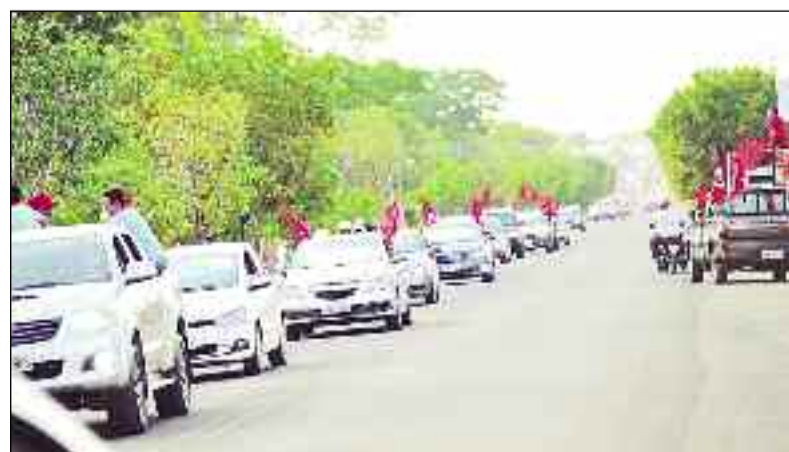
Centenas de carros participaram da megacarreta realizada por Karla