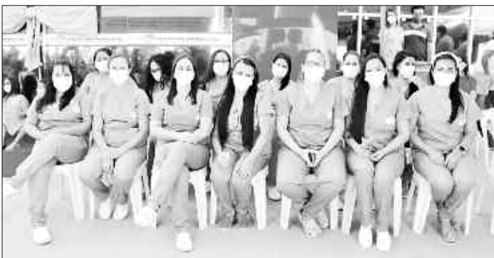
Profissionais de saúde que vão atuar no novo hospital da cidade de São Luiz do Norte