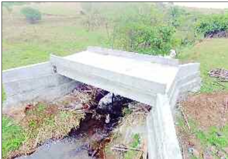
Ponte de concreto pronta para entrega para a população da cidade

Para as próximas semanas, o prefeito destaca a entrega de mais cinco pontes pela zona rural, sendo uma na região do Engenho São Pedro; uma na região do União e duas na região da Baixada da Serra. Todas essas já estão prontas e a quinta será na região do Bom Jardim. Além das pontes, a atual gestão está muito perto de concluir as obras de uma escola modelo e de mais uma praça (Praça Marom da Pehna Ferreira), no setor Papuan, que já havia recebido uma praça e pavimentação asfáltica nova. "Paralelamente a tudo isso, a ad-