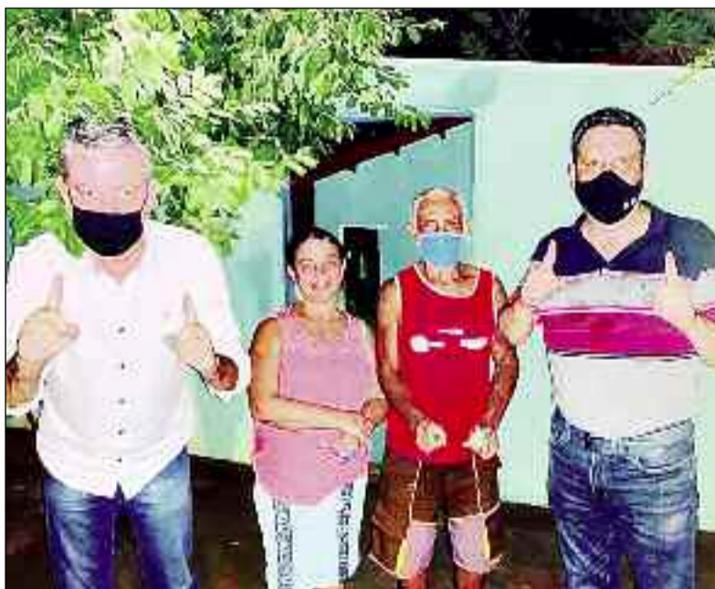
Corpo a corpo com o eleitor de Ceres para garantir novo mandato