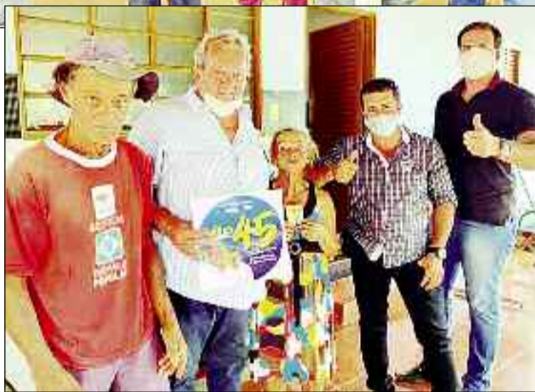
Campanha de corpo a corpo agora ganha a zona rural de Itapaci

Devido à pandemia causada pelo coronavírus, o candidato foi orientado a fazer o mínimo de aglomeração, contudo, fazer política sem juntar gente não é uma coisa tão fácil. De toda forma, o candidato está fazendo visitas com alguns cuidados, como uso de máscara e distanciamento, para assim apresentar suas propostas.