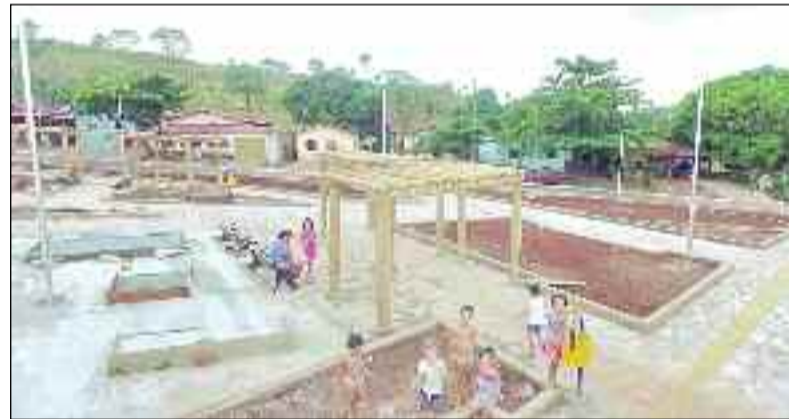
Mais uma praça está sendo concluída: resgate de compromisso