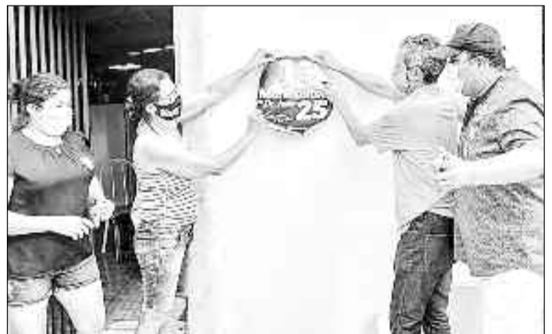
Aceitação da população à candidatura impressiona os organizadores