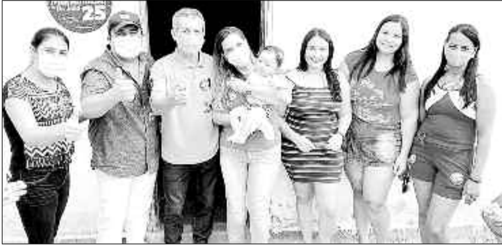
Campanha nas ruas no contato direto com o eleitor de Pilar de Goiás: corpo a corpo