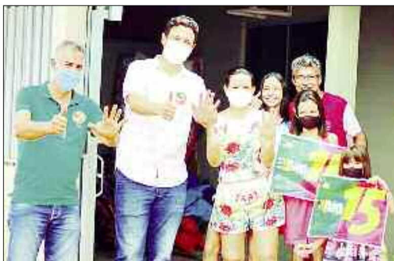
O negócio em Crixás é gastar a sola do sapato e conversar com o eleitor